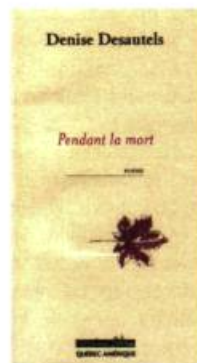
Pendant la mort Denise Desautels