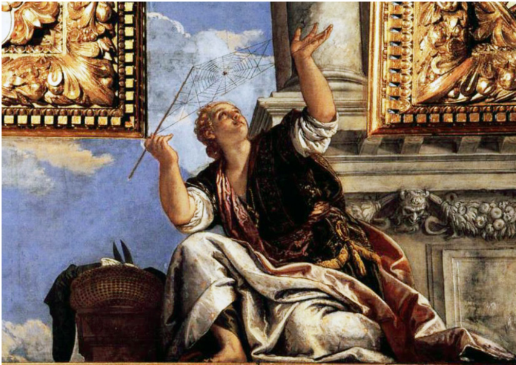
Figure 1. La dialectique ou l'industrie, Véronèse, 1577

Raison) dans la nouvelle civilisation industrielle ; 2) soit il serait l'indice d'une nouvelle orientation prise au XVI e siècle qui annoncerait le remplacement de la dialectique, comprise comme logique formelle qui était le propre de la philosophie scolastique dominante au Moyen Âge, par une nouvelle logique fondée sur les arts mécaniques. Dans cet article, nous nous appuyerons sur les deux interprétations du tableau de Véronèse proposées par Musso pour analyser l'émergence de l'intelligence artificielle aux XX e et XXI e siècles. La thèse qui nous servira de fil conducteur dans cet article se décline ainsi : les développements de l'intelligence artificielle depuis les années 1950 participent au transfert de souveraineté de l'État vers l'organisation 2 qui s'est effectué par la disqualification de la langue au profit du nombre 3 , c'est-à-dire de la loi au profit du code (informatique 4 ).