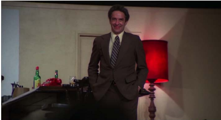
Maurice/Marty s'adresse à la foule, rit et la regarde directement

C'est un autre des « hors-sujets » d' Opening Night : Myrtle devra trouver le moyen d'entraîner Maurice non plus à jouer la pièce, mais à se jouer d'elle, et ce, devant le grand public de la première à New York. Plus encore, une telle dédramatisation deviendra le nouveau point focal du film, le nouveau noyau de l'action. Du même coup, cette action déterritorialisée (en ce qu'elle passe de l'écrit dramatique à l' acte ) devient un vecteur existentiel : c'est en redramatisant The Second Woman que Myrtle et Maurice, improvisant devant la foule new-yorkaise, en viendront à s'aimer à nouveau et à poursuivre leur idylle, sur une scène où la conjugalité s'exprime et où rien ne préexiste, sinon l'acte, les forces et les puissances.