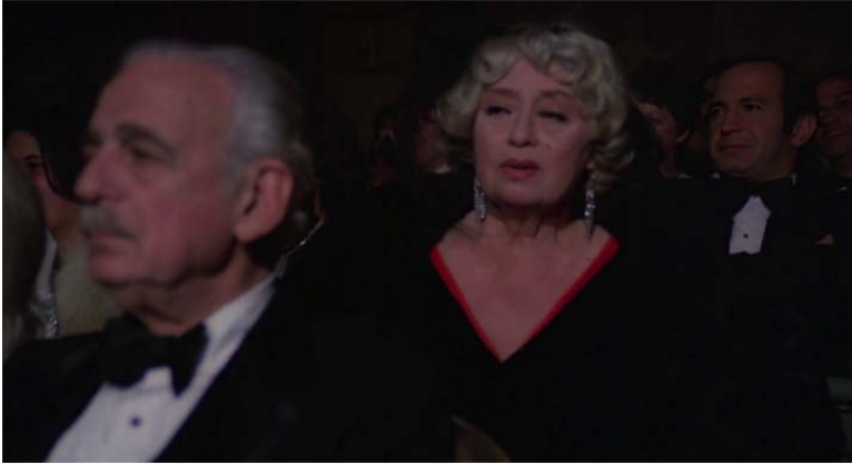
De l'avant à l'arrière-plan : réactions mitigées du producteur, de l'auteure et du metteur en scène de la pièce enchâssée dans Opening Night

On citera à bon escient une grande partie de leur conversation, qu'ils ont non plus en tant que « Virginia » et « Marty » (même s'ils continuent à se répondre en utilisant les prénoms de leurs personnages), mais en tant que Myrtle et Maurice (et il ne faut pas oublier qu'il s'agit du couple réel Rowlands/Cassavetes) :