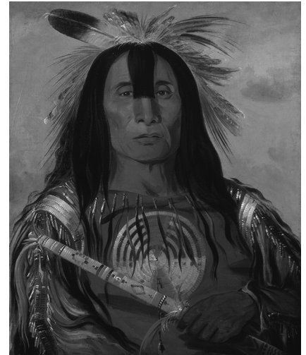
Stu-mick-o-súcks, Buffalo Bull's Back Fat, Grand chef de la nation Gens-du-Sang (Huile sur toile de George Catlin, 1832)

Avec Bison , publié en janvier 2014, l'auteur nous offre un superbe bouquet Grainville. Il nous conte en effet le séjour du peintre Catlin chez les Sioux au cours d'un bel été de la décennie 1830, époque de la déportation des Indiens de l'est à l'ouest du Mississipi. Aussi le lecteur est-il reconnaissant à Patrick Grainville d'avoir, à partir, entre autres, des Lettres et Notes et des tableaux de Catlin, fait revivre ce monde des Indiens des Plaines, leur culture florissante, dynamique et complexe, exultante de forces et de savoirs, de libertés et de spiritualité (Catlin 1978 [1844]). L'hommage au talent de Catlin est rehaussé par les comparaisons que file Grainville avec d'autres peintres