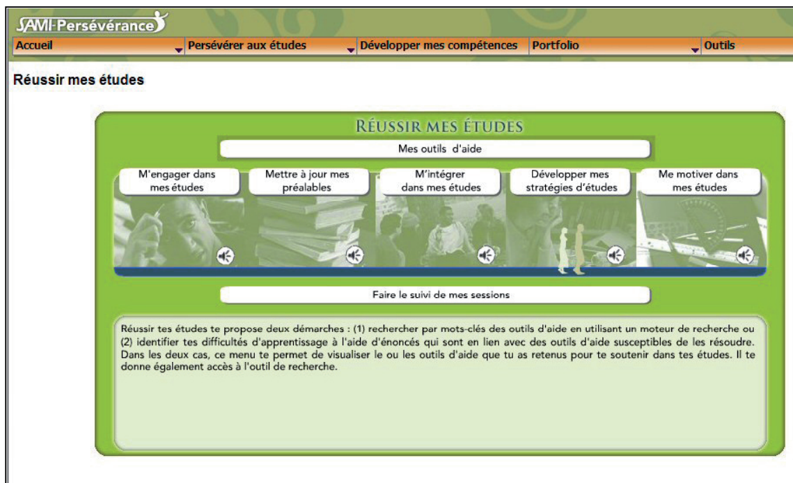
Figure 1. Catégories de difficultés proposées par SAMI-Persévérance

Pour chaque catégorie, nous avons également défini des sous-catégories comme suit :