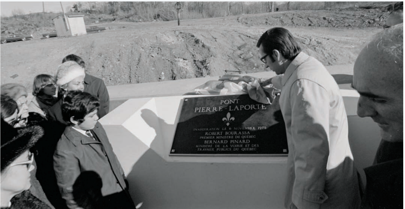
Inauguration du pont Pierre-Laporte. Jules Rochon, novembre 1970. (Bibliothèque et Archives nationales du Québec. E10S44S51D70279).

Initialement, ce pont avait été baptisé Pont Frontenac , en souvenir de Louis de Buade, comte de Frontenac et de Palluau gouverneur général de la Nouvelle-France.