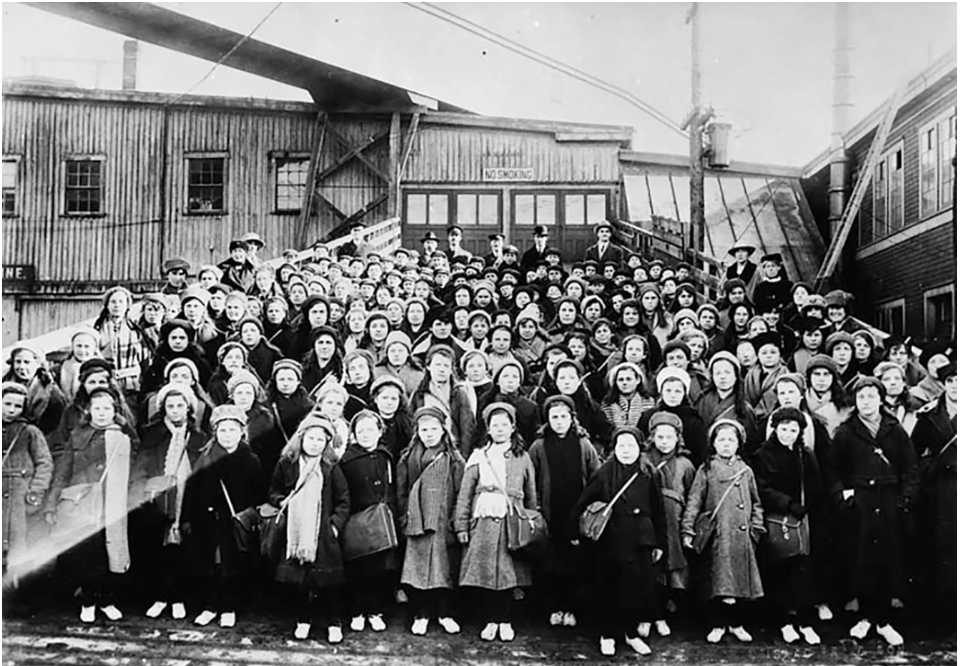
Enfants immigrants des orphelinats du D r Thomas Barnardo au ponton de débarcadère, Saint John, Nouveau-Brunswick.