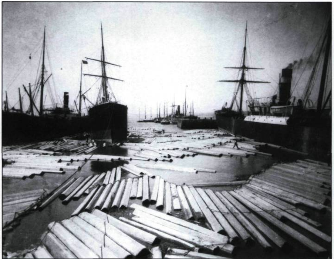
Vue de l'Anse-aux-Sauvages, à Lauzon, en 1895.

le potentiel de ses rivières et ses nombreuses anses constitue un territoire des plus attrayants. Conjuguons à cela la profondeur du chenal du fleuve Saint-Laurent qui permet aux bateaux anglais de fort tonnage de venir jusqu'à ses rives et l'apport de nouveaux éléments fort dynamiques que sont les «lumber Lords» et nous retrouvons ainsi tous les facteurs qui enclenchent le processus d'appropriation et d'exploitation du littoral sud.