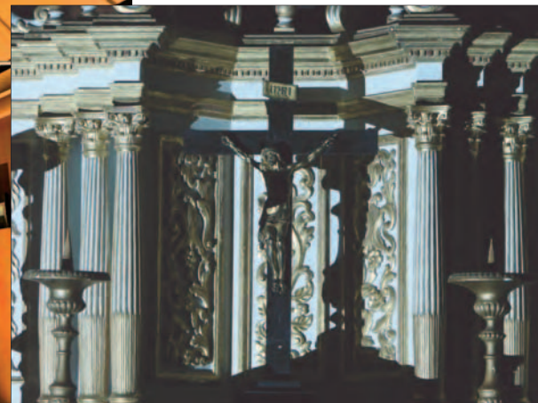
Des essais ont ensuite été effectués sur les lieux réels.