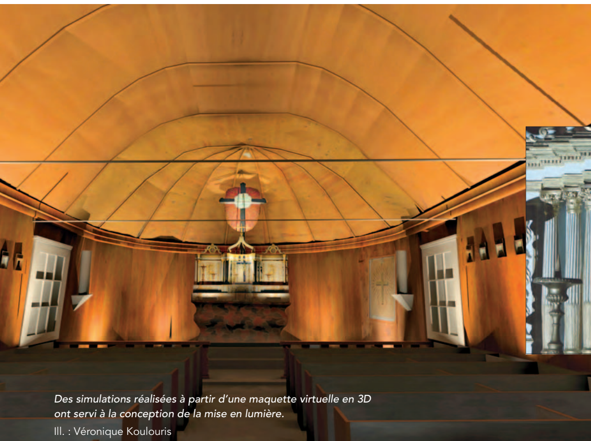
Des simulations réalisées à partir d'une maquette virtuelle en 3D ont servi à la conception de la mise en lumière.