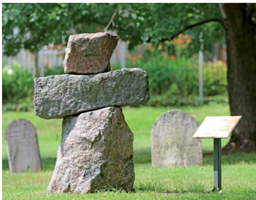
Au cimetière Mount Hermon, des défunts de différentes confessions et origines se côtoient. On y trouve notamment des Inuits, comme en témoigne cette stèle.