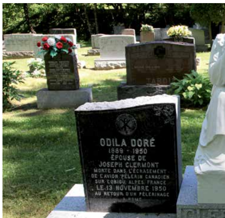
Plusieurs visiteurs du cimetière Notre-Dame-de-Belmont demandent à voir s'est produit en 1950 sur le mont Obiou, en France.