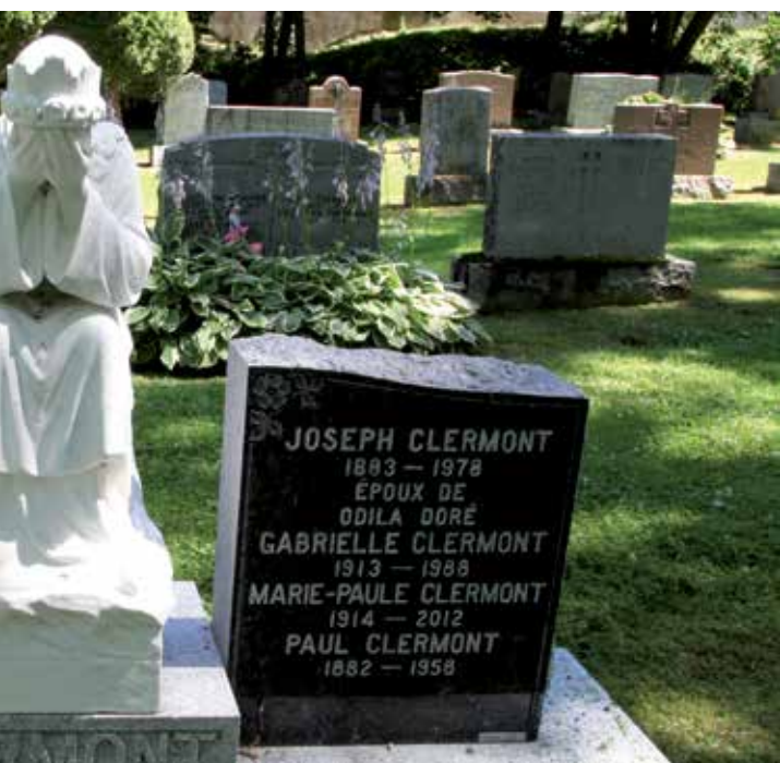
ce monument en mémoire d'une des victimes de l'écrasement d'avion qui