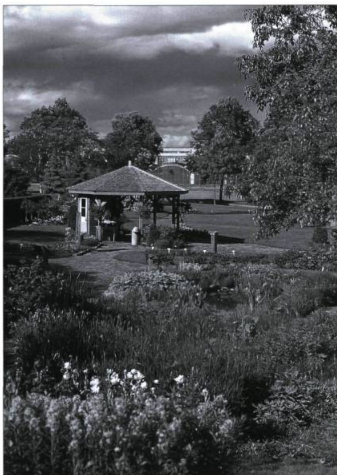
Depuis 1966, le Jardin Van den Hende, associé à l'Université Laval, joue le rôle de jardin pédagogique.