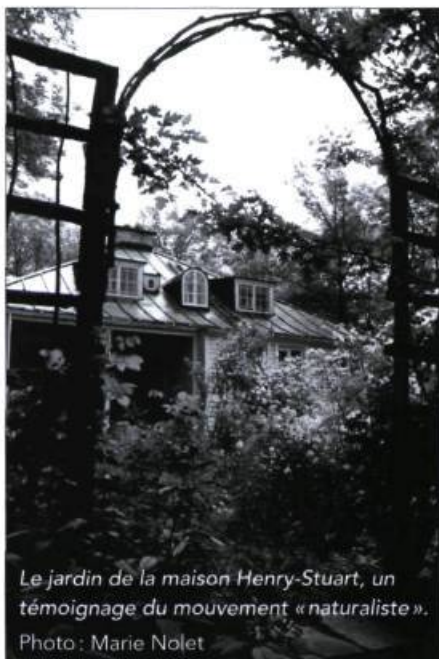
Le jardin de la maison Henry-Stuart, un témoignage du mouvement « naturaliste ».

Il faut attendre 1988 pour voir l'État québécois accorder à un jardin le statut de bien culturel en vertu de la Loi sur les biens culturels. Le jardin de la maison Henry-Stuart, à Québec, est le premier à être reconnu pour ses caractéristiques culturelles et patrimoniales propres et non pas en tant que prolongement d'un bâtiment historique. Avec la maison et ses intérieurs, le jardin Henry-Stuart forme une entité protégée indissociable. Plus récemment, le Canada reconnaissait la valeur patrimoniale de chaque composante en désignant la maison Henry-Stuart et son environnement monument et lieu historique national.