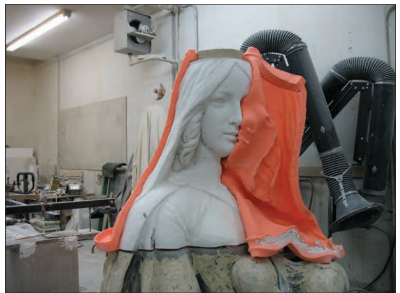
La tête et la couronne de la statue ont dû être remoulées et remplacées. Grâce à une photographie, il a été possible d'en améliorer les détails en respectant l'œuvre originale.