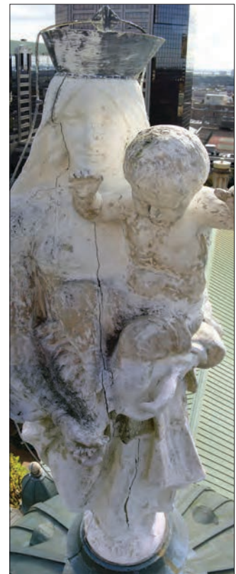
Avant sa restauration, la Vierge arborait un chapeau de tôle en guise de paratonnerre...