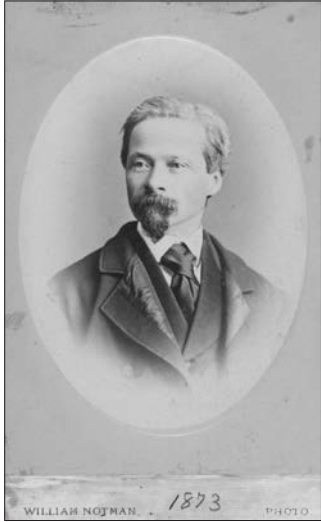
Napoléon Bourassa, 1873. Photo de William Notman. Carte de visite, épreuve à l'albumine argentique, 9,1 x 6,1 cm (image), 10,2 x 6,3 cm (carte).

Source : MNBAQ, fonds Jeanne-Bourassa, album de la famille Bourassa, B-7. Don en 2010