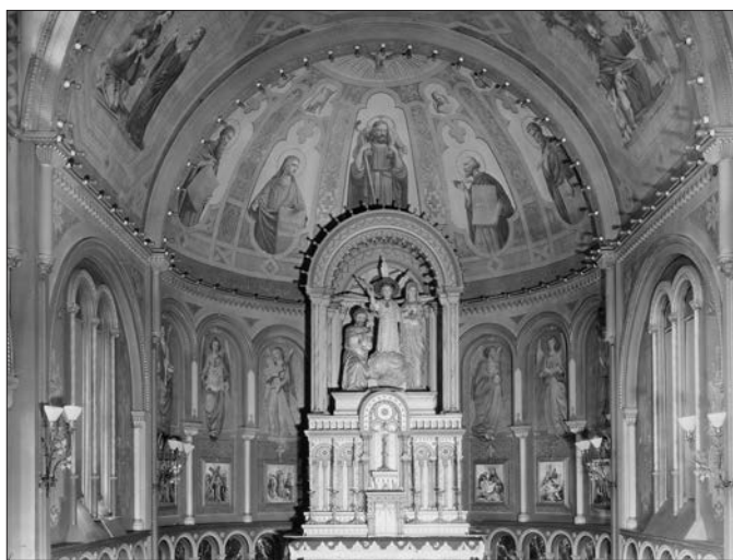
Le chœur de la chapelle Nazareth, à Montréal, peint par Napoléon Bourassa entre 1870 et 1872. Photo du studio Notman, Montréal, vers 1925. Épreuve à la gélatine argentique, 24,5 x 19,7 cm.

Source : MNBAQ, fonds Anne-Bourassa, K7097. Don en 1978