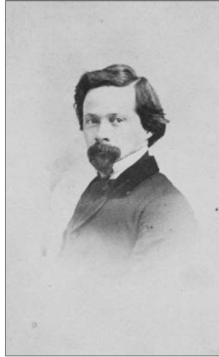
Napoléon Bourassa, 1863 ou 1864. Photo de James-Louis Demers. Carte de visite, épreuve à l'albumine argentique, 9 x 5,9 cm (image), 10,7 x 6,2 cm (carte).

Source : MNBAQ, fonds Jeanne-Bourassa, album de la famille Bourassa, B-7. Don en 2010