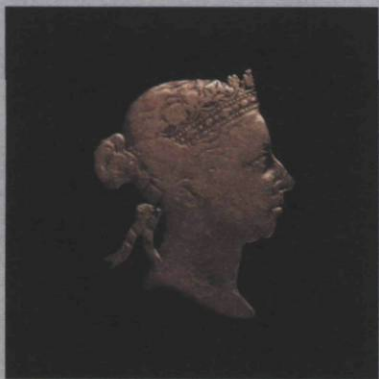
Mathieu Beauséjour, Kings and Queens of Québec , 2008

Plus métaphorique mais aussi fidèle à son esthétique, Mathieu Beauséjour nous offre une série de portraits métallisés, portés en médaillons. Les Kings and Queens of Quebec font certes écho aux prétentions