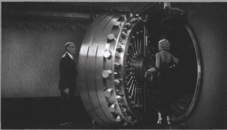
Un capitalisme sentimental, 2008, 93 min.