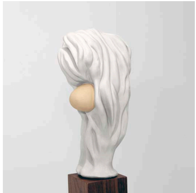
Dominic Papillon, Tête de faune , exposition Drôlerie , 2014. Plastique uréthane, bois (noyer).

Cette confusion homme-animal est clairement exposée avec l'œuvre Faramine . Provenant de l'ancien français, ce mot signifie bête fantastique. Ressemblant à un jouet, cette représentation stylisée d'un sphinx n'est pas banale. Dans son Esthétique , Hegel associe le sphinx de l'ancienne Égypte au symbolisme. Il incarne mieux que tout l'esprit encore prisonnier de la force brutale de l'animal. Toutefois, au sein de cette exposition, Faramine de Papillon semble davantage souligner, par la répétition humoristique d'une légende, le retour du sphinx détenteur d'une énigme sur ce qu'est l'humain, pour ne pas dire sur ce qu'est l'art.