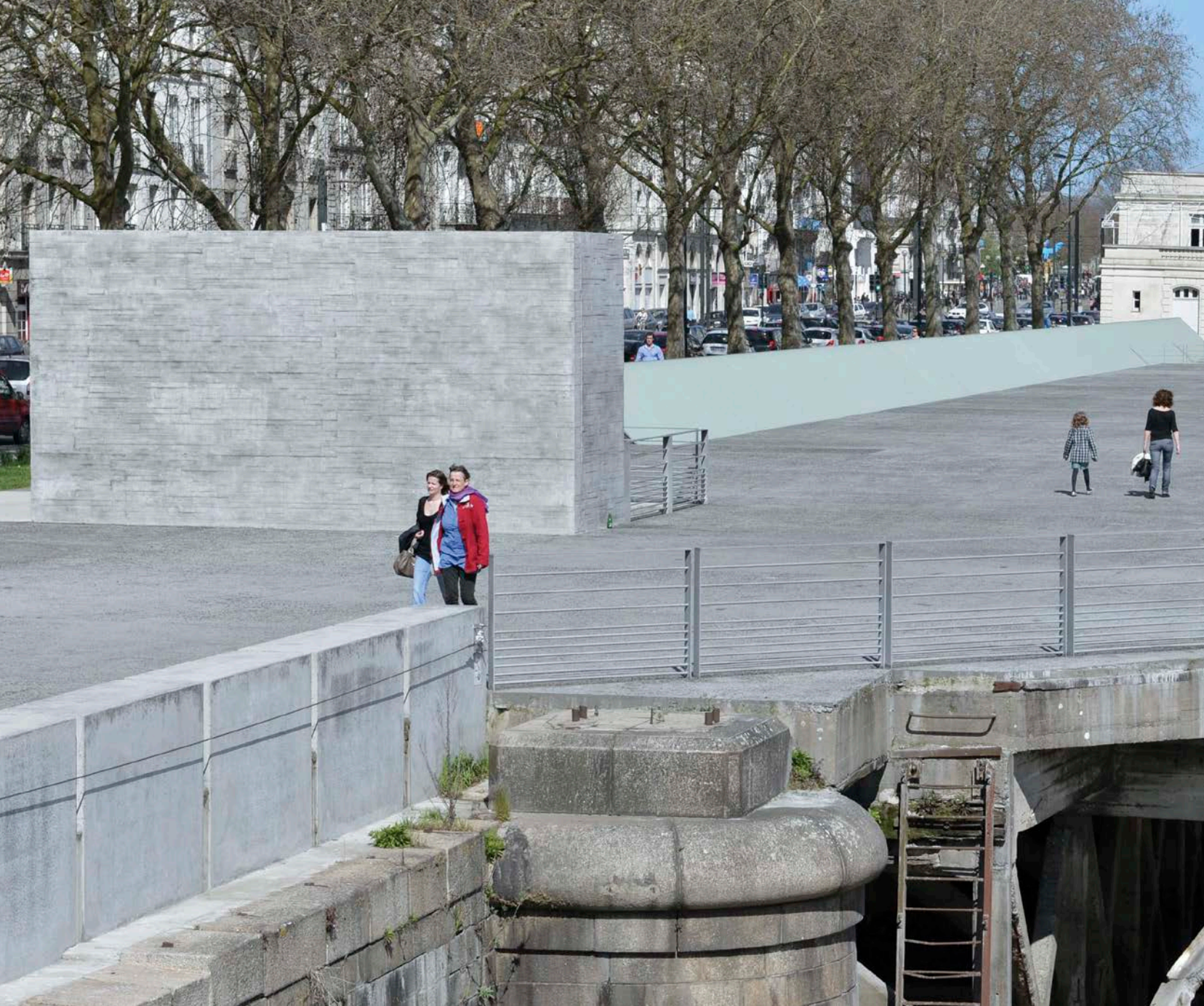
Krzysztof Wodiczko et Julian Bonder, Le Mémorial de l'abolition de l'esclavage. Parcours commémoratif, 2013/ Krzysztof Wodiczko and Julian Bonder, Memorial to the Abolition of Slavery. The Commemorative Path, 2013, Nantes.