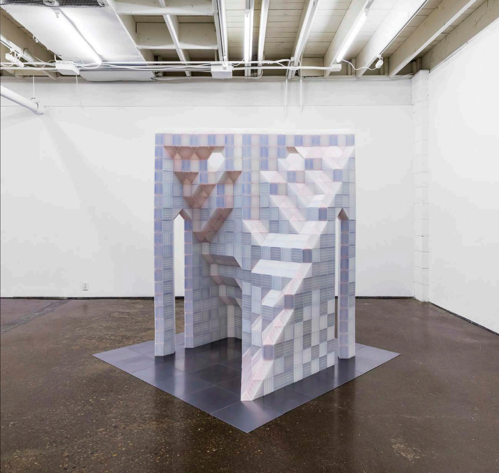
Jesse Colin Jackson, Marching Cubes , 2016. Partial view of the exhibition/ Vue partielle de l'exposition. Cold-rolled steel plate, fused-deposition polylactic acid, neodymium magnets/ Plaque d'acier laminé à froid, acide polylactique à dépôt fondu, aimants en néodyme.