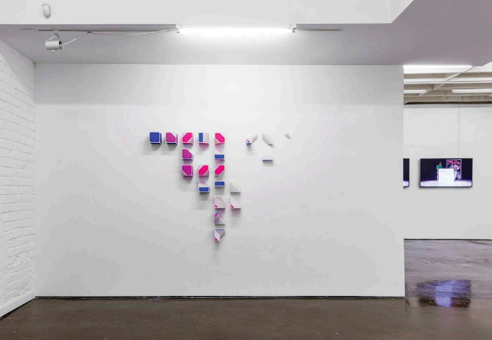
Jesse Colin Jackson , Marching Cubes , 2016. Partial view of the exhibition/Vue partielle de l'expositon. Cold-rolled steel plate, fused-deposition polyactic acid, neodymium magnets/ Plaque d'acier laminé à froid, acide polylactique à dépôt fondu, aimants en néodyme.

Jackson describes the sculpture shown at Pari Nadimi as a “refinement” of one of the forms created during the xMPL event. A single possible arrangement of an open system, the assembly itself is secondary to the underlying process. Which is of course a credo that has been part of our everyday vernacular for a while: kids used to build with Lego bricks, now they snap voxels together in Minecraft . Real or virtual? Tangible or mediated? With each passing day, these binaries melt away a little more, thoughts and gestures fluidly move back and forth between our consciousness and ‘the digital.’ Constructing our news feed based on ideological preferences, analyzing traffic patterns to determine optimal routes across the city—algorithms shape so much of our perception, and Jackson’s Marching Cubes is one of a rare breed of sculptural projects that not only acknowledges this fact, but also commandingly harnesses one to author a related aesthetics.