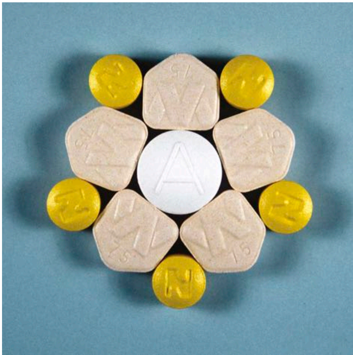
Colleen Wolstenholme , Pentagram , 1999. Impression à jet d'encre/Inkjet print, 84 x 84 cm. Édition de 10/Édition of 10.