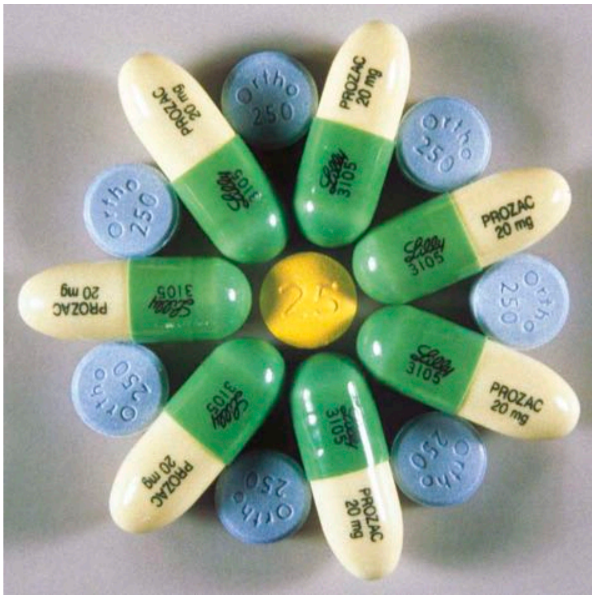
Colleen Wolstenholme, Mandala , 1999. Impression à jet d'encre/Inkjet print, 84 x 84 cm. Édition de 10/Édition of 10.