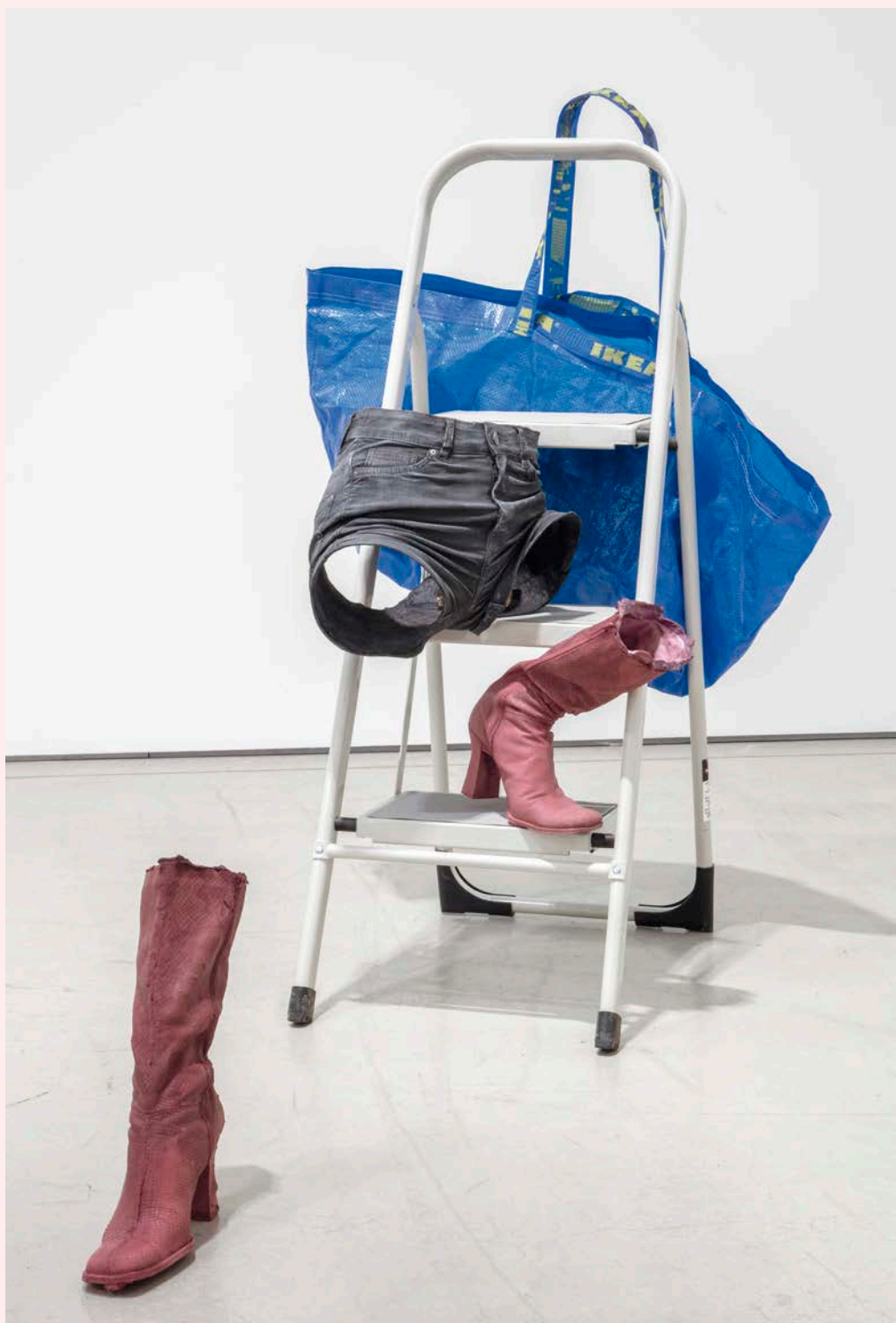
Valérie Blass , Ceux qui ne demandent rien , 2019. Marchepied, peinture mixte (acrylique, gouache, huile), fibre de verre, sac Ikea et brique.

À l'occasion de la remise du prestigieux Prix Gershon Iskowitz 2017, l'artiste montréalaise Valérie Blass présente une exposition personnelle au Musée des beaux-arts de l'Ontario à Toronto, du 18 mai au 1 er décembre 2019. Sous le titre Le parlement des invisibles , Blass réunit ses sculptures les plus récentes, faisant suite à la rétrospective de son travail organisée par Oakville Galleries plus tôt cette année (en circulation à la Douglas Hyde Gallery à Dublin jusqu'au 7 septembre).