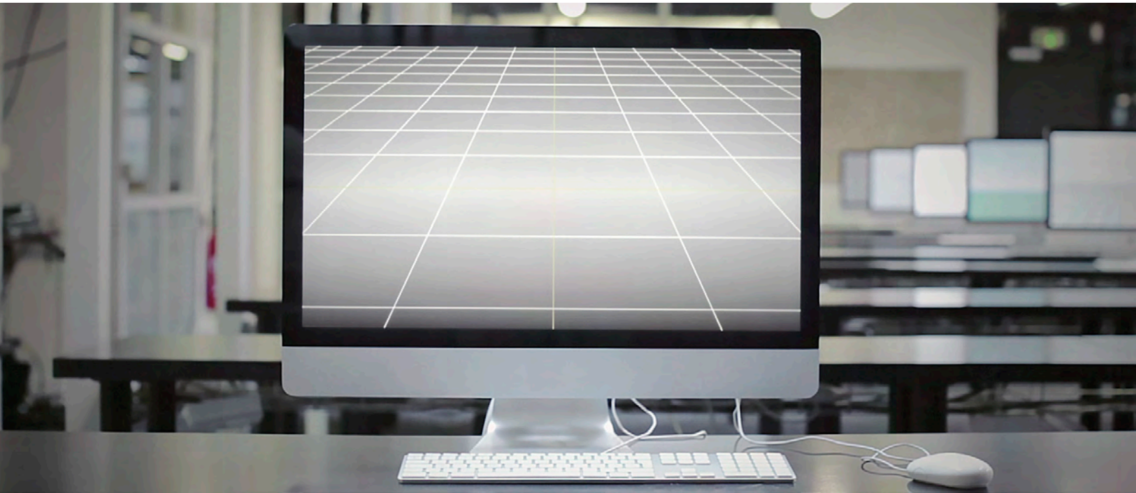
Julien Prévieux, Anomalies construites , 2011. Vidéo HD, couleur, son, 7 min 41 s.

nos artefacts. En voix hors champ, deux narrateurs confrontent successivement leur vision du logiciel de modélisation 3D SketchUp qui permettait à tout un chacun de réaliser des modèles 3D de bâtiments ou de monuments pour Google Earth. Ce divertissement apparemment « gratuit » profitait pleinement à Google puisque l'utilisateur complétait, grâce à ces modèles, l'environnement virtuel encore en friche. Cet essai vidéo tente de mettre en lumière la tension entre loisir créatif et travail camouflé. Les deux témoignages rendent compte, pour le premier, d'une approche passionnée tirant satisfaction de la reconnaissance de son talent par le géant de l'informatique; l'autre, beaucoup plus critique, décelant une forme de travail déguisé. Ce phénomène n'a fait que s'amplifier depuis : des réseaux sociaux qui aspirent les données personnelles pour les monnayer, des microtravailleurs sous-payés, des CAPTCHA pour faire de la reconnaissance « humaine » de caractères ou améliorer des systèmes d'intelligence artificielle. Le branchement en dérivation des entreprises numériques sur l'activité humaine a produit une forme d'exploitation dont parle très bien Antonio Casilli dans En attendant les robots. Enquête sur le travail du clic (Éd. du Seuil, 2019).