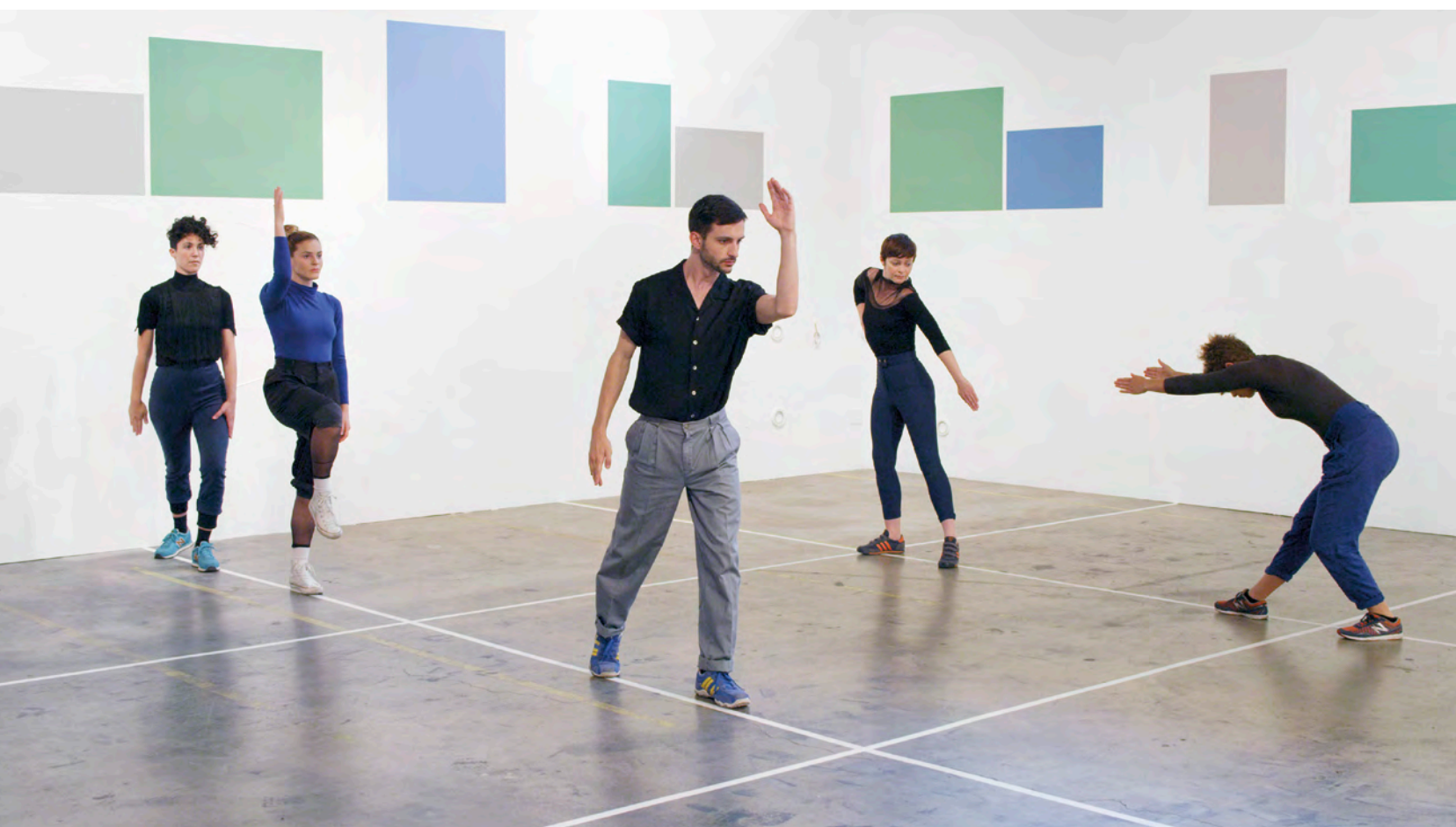
P. 50 : Julien Prévieux, What Shall We Do Next? (Séquence #2, détail), 2014. Vidéo HD (photogramme), 16 min 47 s.