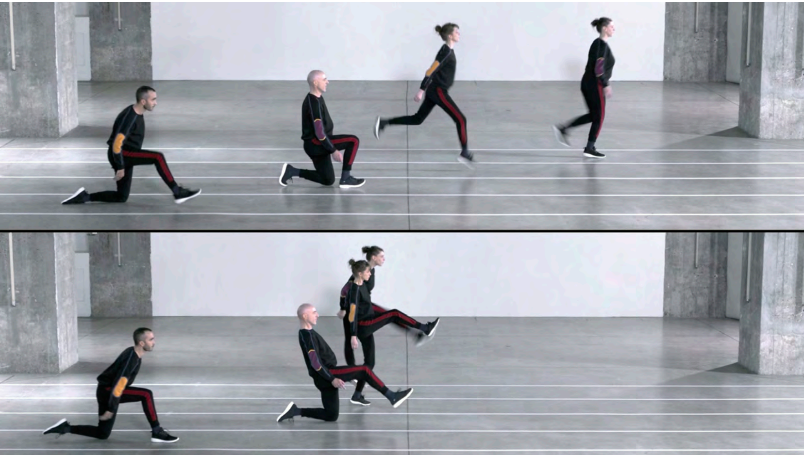
Julien Prévieux, Where Is My (Deep) Mind? , 2019. Vidéo HD, couleur, son, 15 min. Photo : © Julien Prévieux.

mentale les usages de la quantification comme moyens de contrôle et de domination. On peut distinguer quatre grandes manières de faire. La première indique des pistes pour l'étude du Statactivism au sens large. Il s'agit, par un retour historique, d'interroger ce qu'a pu être la critique par les nombres. Une deuxième méthode consiste à ruser, individuellement et souvent secrètement, avec les règles de rendu des comptes de façon à s'approprier les résultats de l'exercice. La troisième mobilise les statistiques pour consolider des catégories collectives sur lesquelles s'appuyer pour revendiquer des droits. Enfin, il s'agit aussi de produire des indicateurs alternatifs pour redéfinir le sens de nos actions.