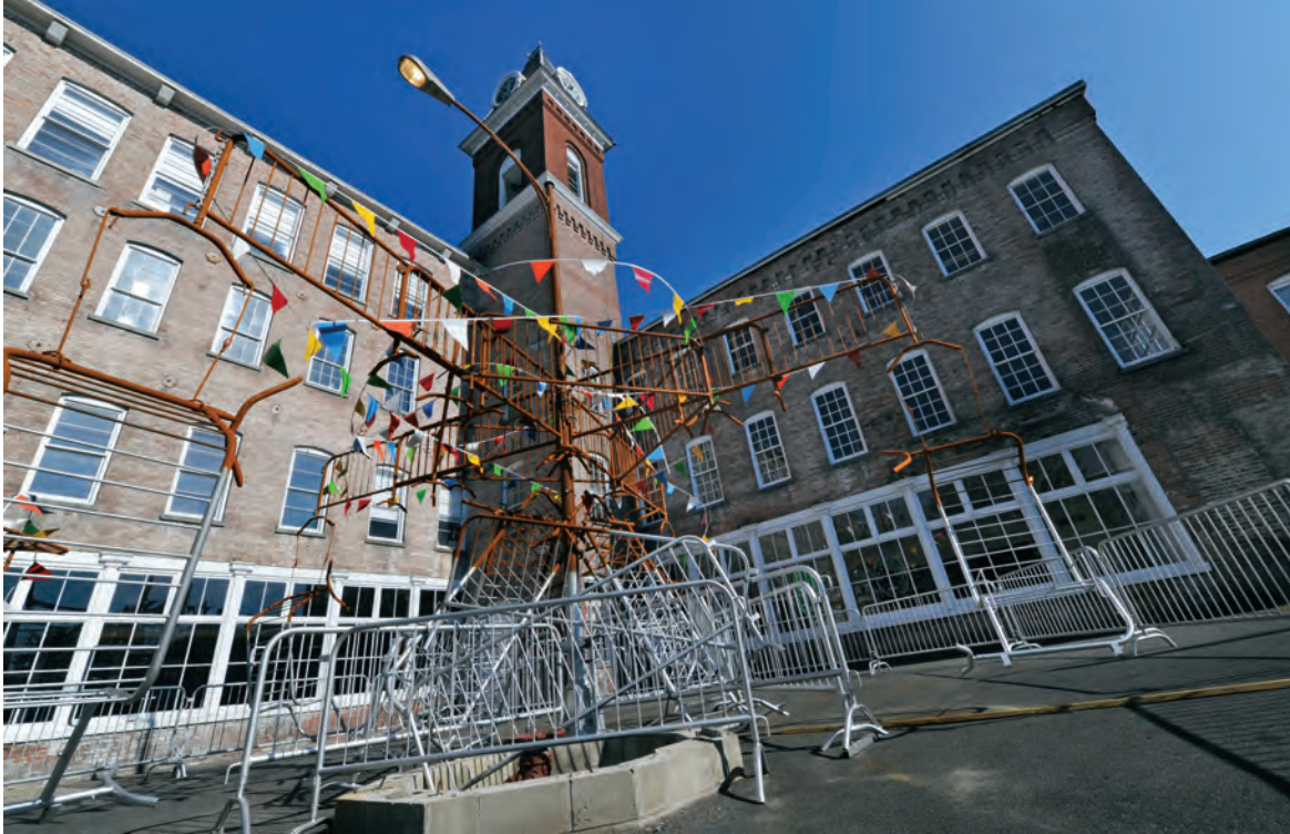
BGL, Canada de Fantaisie , 2012. Médiums mixtes.