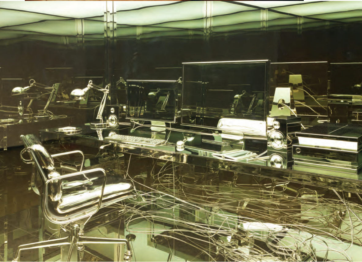
Nicolas BAIER, Vanité/Vanitas , 2012. Aluminium, nickel, acier, verres, fluorescent.

autochtones et masculins dans une double mise en scène aux limites du drame et de l'humour, qui prend place dans un chalet en bois rond, où cowboys et Indiens se fréquentent.