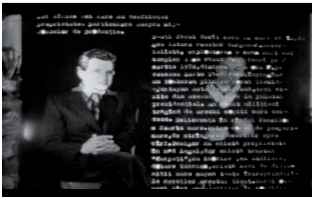
ION GRIGORESCU, DIALOGUE WITH CEAUȘESCU , 1978.

directe et frontale qu'elle met en scène. Les autres productions dénoncent la main invisible de l'État de façon moins ostentatoire, comme les photographies de la série Electoral Meeting (1975), qui attirent l'attention sur la présence d'agents secrets lors d'un rassemblement de propagande organisé par l'État. Ou Snagov (1971), qui documente la vie sociale et politique et révèle les limites ambiguës de l'intimité, dans un pays où même les jeux en famille sur les bords d'un lac où les membres du parti passent leurs vacances sont vus comme une activité suspecte.