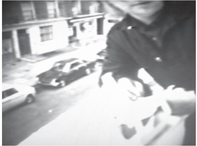
David Askevold, Learning About Cars and Chocolates , capture vidéo | video still, 1972.