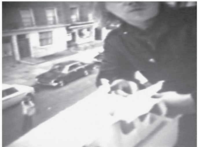
David Askevold, Learning About Cars and Chocolates , captures vidéo | video stills, 1972. photos : © Musée des beaux-arts du Canada, Ottawa, permission de | courtesy of Askevold-Ready Studio Dépôt de la collection vidéographique d'Art Metropole, Toronto, 1997