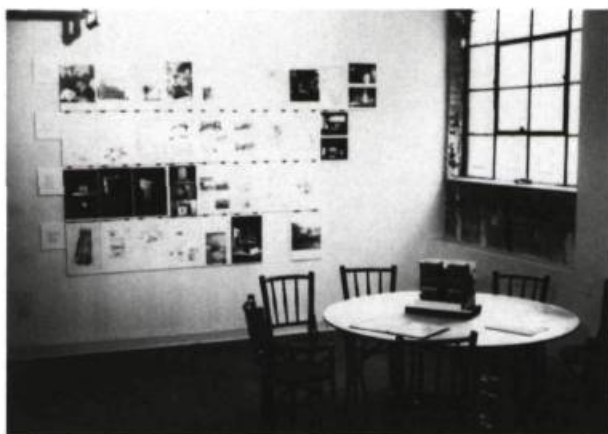
Jacques Rousseau, A table, la maison coloniale , installation.

l'ensemble de ses parcours urbains. Les gens s'installent provisoirement dans des décors versatiles et même ceux qui cultivent des habitudes se trouvent bousculés par les changements incessants du tissu urbain. Le siège, surtout en version individuelle ou de petits groupes figure une rythmique du nomadisme. Les matériaux qu'a utilisés Ruelland vont d'ailleurs dans ce sens. Le néoprène, le corian, l'aluminium, l'acier appartiennent à la ville et restent anonymes, interchangeables.