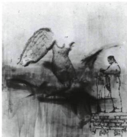
Sigmar Polke, Le rêve de Méléna , 1982. Dispersion sur toile. Collection particulière, Cologne

L'exposition de l'ARC présentait un choix de peintures de 1964 à 1988, dont un assez grand nombre