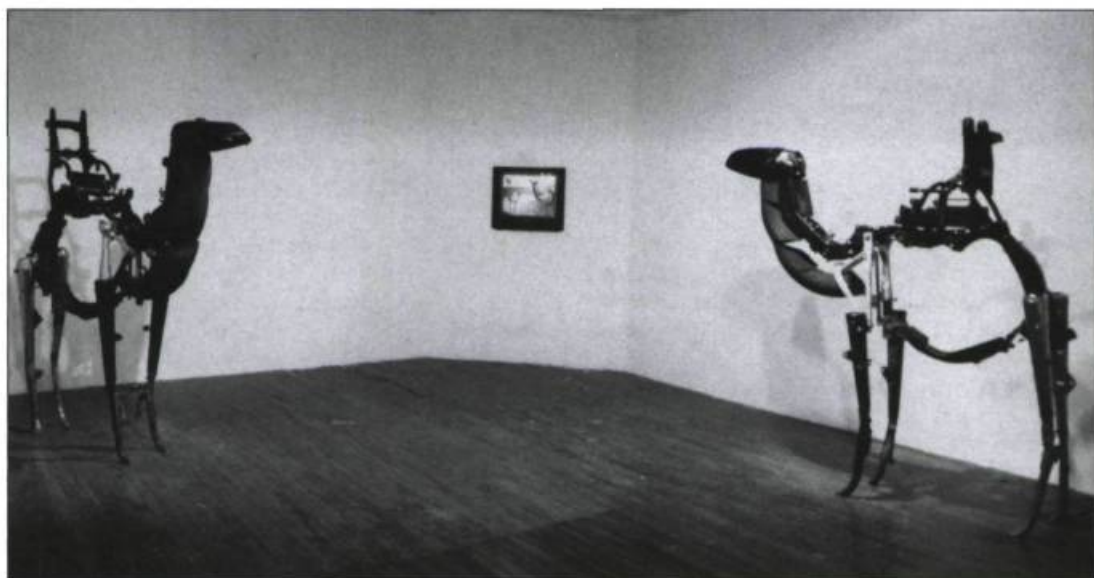
Éric Raymond, Chiasme désert , installation vidéo, pièces de moto, vidéo réalisée sur ordinateur Amiga, 1990.

Eric Raymond, Espace de discours, espace de figures , Galerie Skol, du 11 août au 2 septembre 1990 —