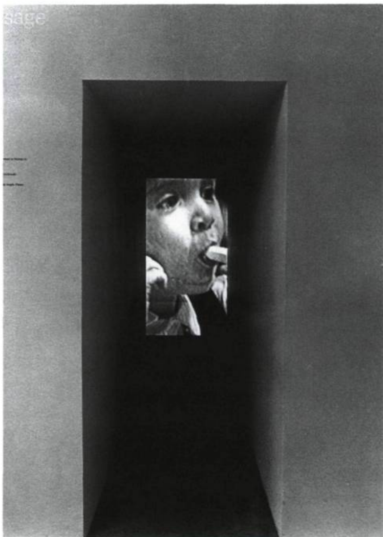
Bill Viola, Passage , 1987. Installation vidéo.

Même déconstruction de l'image et d'une situation dans L'Été - Double vision de Thierry Kuntzel. D'un côté, un écran de dimension normale reproduit une scène tout ce qu'il y a de bucolique (quoique dans le registre du fantasme sexuel !). Un homme, noir, nous tourne le dos, assis dans une méridienne où il feuillette un livre de reproductions de Poussin, en arrêt devant L'Été . Devant lui, une magnifique scène champêtre est