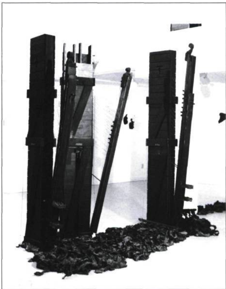
Paul-Émile Soulnier, Déplacements nocturnes , 1991 (détail).

du monde nouveau, de choses nouvelles qui comme la vidéo en installation ont le pouvoir de rénover autour d'elles les autres anciennes choses, de leur donner une forme neuve 10 et qui obligent le spectateur à s'adapter à elle.