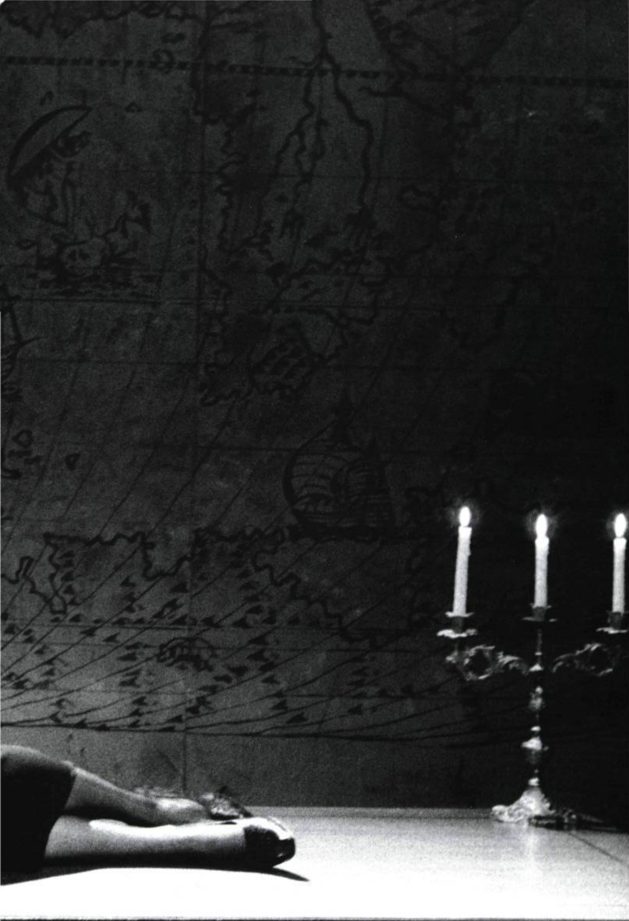
Perdus dans les coquelicots de Pigeons International. Comédienne : Leni Parker.