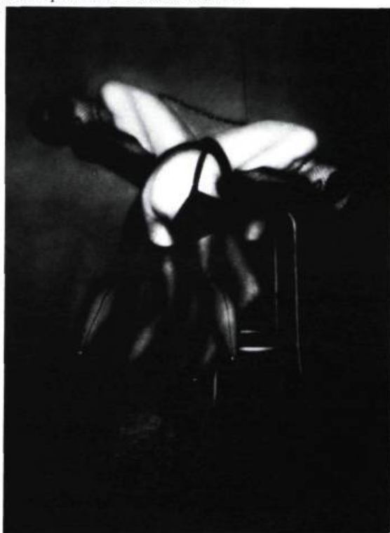
Pierre Molinier, Pantomime céleste , 1967. Montage photographique; 15,8 x 11,3 cm. Wayne Boerwaldt pour Francesco Conz, Verone. Françoise Molinier et Urbi et Orbi Galerie, Paris.

de nos objets de fascination. Ses œuvres nous disent que cela a été. Elles sont des autoportraits : de l'effigie du miroir, de l'image dont la priorité ontologique tient son origine dans la non-séparation des sexes d'un monde adamique sans une morale du voir.