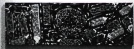
Présentation de l'exposition Terre et feu de Jean-Paul Riopelle, Musée d'art contemporain de Montréal, automne 1993.

un reçu qu'il doit brûler, tandis que l'artiste jette la moitié de l'or à la rivière (en l'occurrence, la Seine) » 3 . Cette attention portée à la signature était aussi partagée par l'artiste belge Marcel Broodthaers, qui confectionna entre autres un socle couvert de ses initiales. Ces trois artistes ont tous eu droit, en leur temps, à l'épithète fumiste. La Fontaine signée R. Mutt n'était-elle pas, du propre aveu de son auteur, une plaisanterie ? En plus du fait que l'urinoir était, à