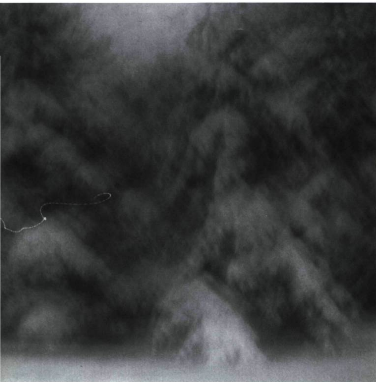
Jean-François Côté, Sans titre , 1996-97. Photographie couleur.

contexte artificiel à même de simuler le réel. La suggestibilité induite à partir des œuvres d'art possède une mobilité qui s'ouvre vers des fictions tout en maintenant une conscience de la relativité spatiale. L'unification de plusieurs niveaux de réalité dans un art suggestif, allusif, elliptique fait osciller l'œuvre entre image et signe. Le défini émerge de l'indéfini avec un vœu d'authenticité et d'artifice. La technologie favorise, à sa façon, la conaturalité de l'homme et du monde organique, désormais