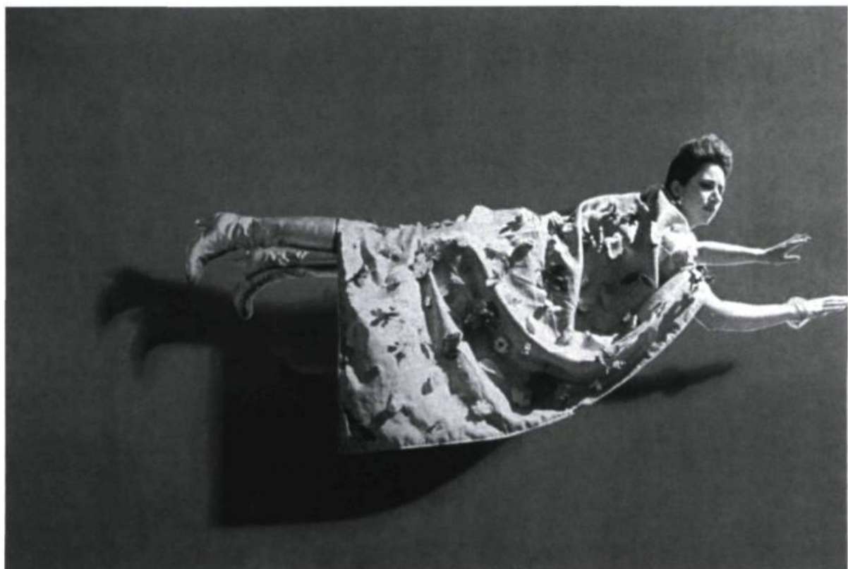
Carol Sawyer, Amazon , 1998. Installation.

La sexualité n'est plus réduite à ses communs dénominateurs, à ses fonctions vitales, aux gestes « dérisoires » et nécessaires du rituel quotidien. Elle porte souvent le flambeau d'une guerre contre la société, d'un appel à la transgression et d'une révolte contre des individus dont les comportements sont abusifs et sans fondement. La sexua-