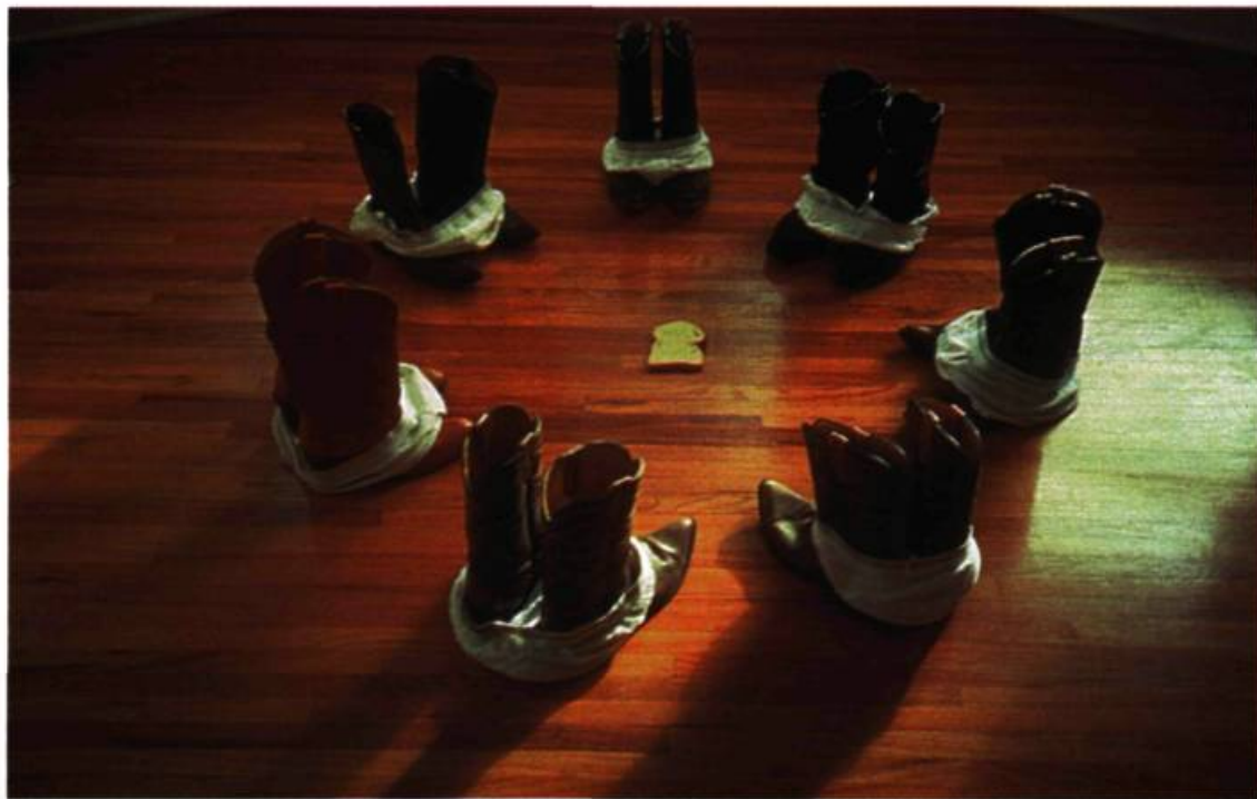
Evergon, Gunfight at the OK Corral , 1996. Photographie. © Galerie Trois Points, Montréal.

L'inscription de la sexualité dans la structure socio-sémantique de l'œuvre d'art actualise et perpétue la part profonde de nous-mêmes. Notre conception de ce qui est aberrant, comme nos idées concernant la morale, sont les héritières de la tradition judéo-chrétienne. Les discours sociaux, les imaginaires collectifs et les systèmes symboliques hérités d'une sexualité socioculturelle stéréotypée sont remis depuis déjà un bon moment en question, par la représentation de nos désillusions qui va de pair avec l'effondrement des idéologies dont les sentiments dominants sont la déception et la négativité. Les icônes contem-