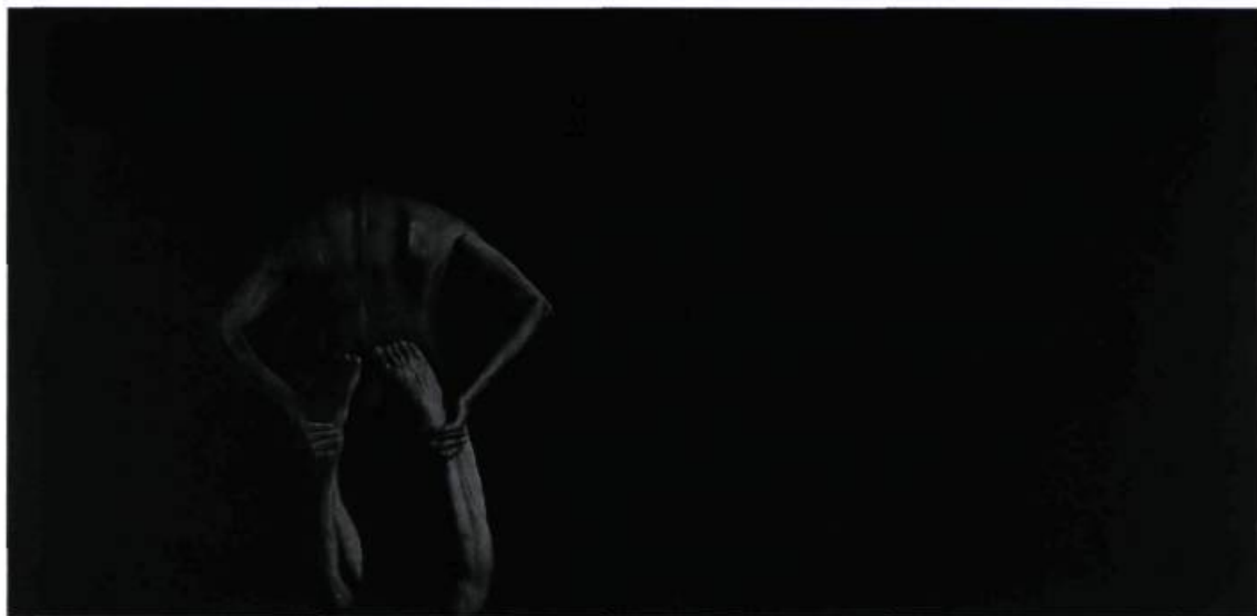
Marc Séguin, Paysage intérieur # 2 , 1999. Huile sur toile; 150 x 300 cm.

c'était le cas des portraits de vieillards présentés chez Trois Points en juin dernier, le personnage accompagné de son double induit un questionnement identitaire face à l'image de soi. Enfin, à l'instar de Gare centrale , un petit tableau fortement ancré dans une tradition iconographique, présenté lors de l'événement Les Peintures (Montréal), pendant l'été 1999, au cours de l'été dernier chez René Blouin, la mariée fait ici figure de vanitas et rappelle certains tableaux de Klimt et de Böcklin.