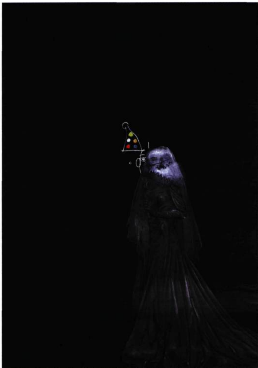
Marc Séguin, Les nocés , 1999. Huile sur toile; 300 x 210 cm.

Séguin renvoient aux drames qui se déroulent sur la scène théâtrale de la vie. Le tableau noir, où ce qui est donné à voir est aussi donné à vivre, devient le lieu d'une méditation métaphysique sur le caractère transitoire, éphémère et précaire de l'existence face à l'immensité de l'univers.