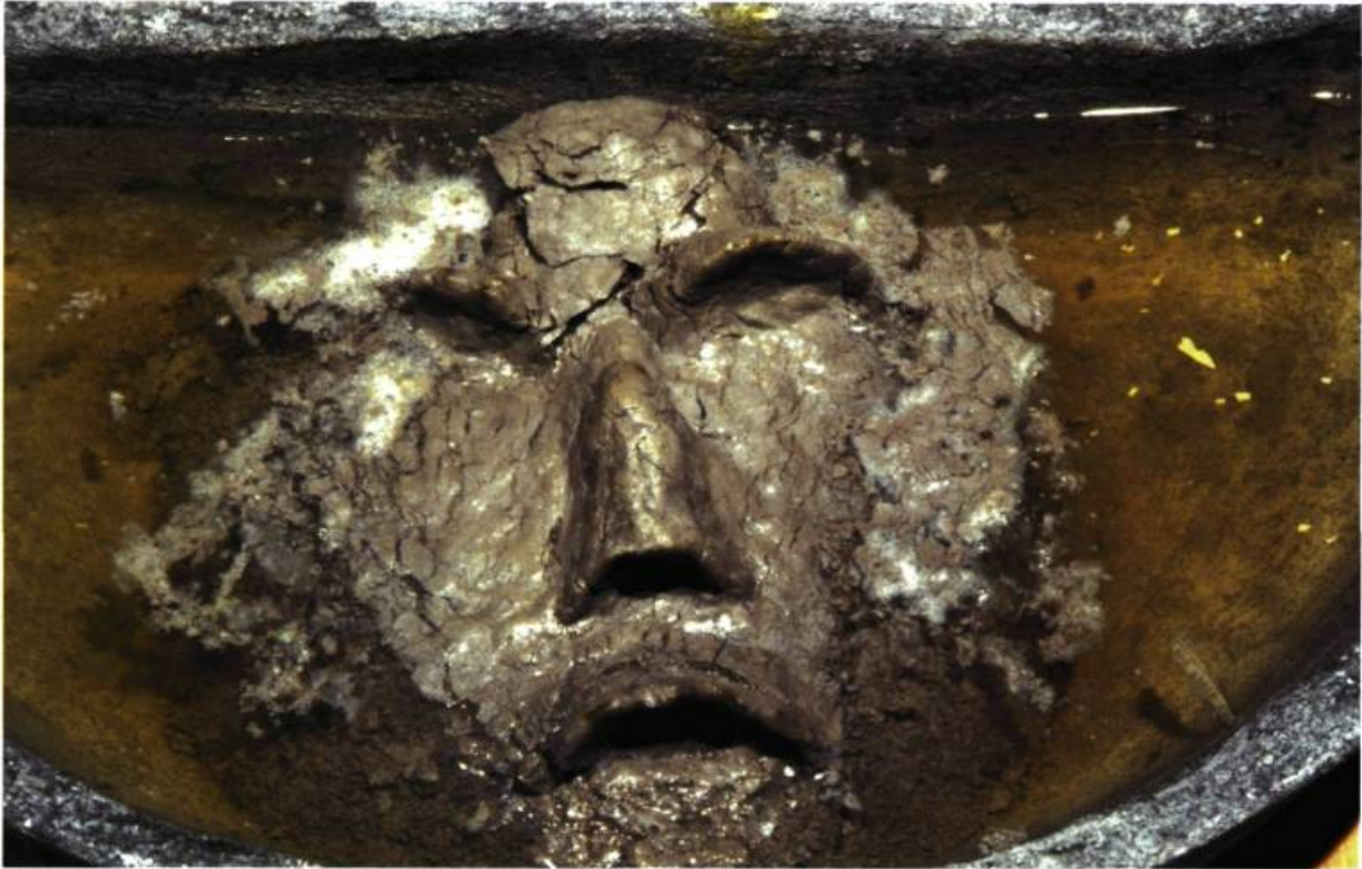
Diane Trépanière, Par ici , 2001 (détail). Installation