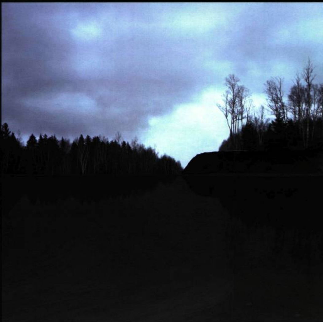
Modified