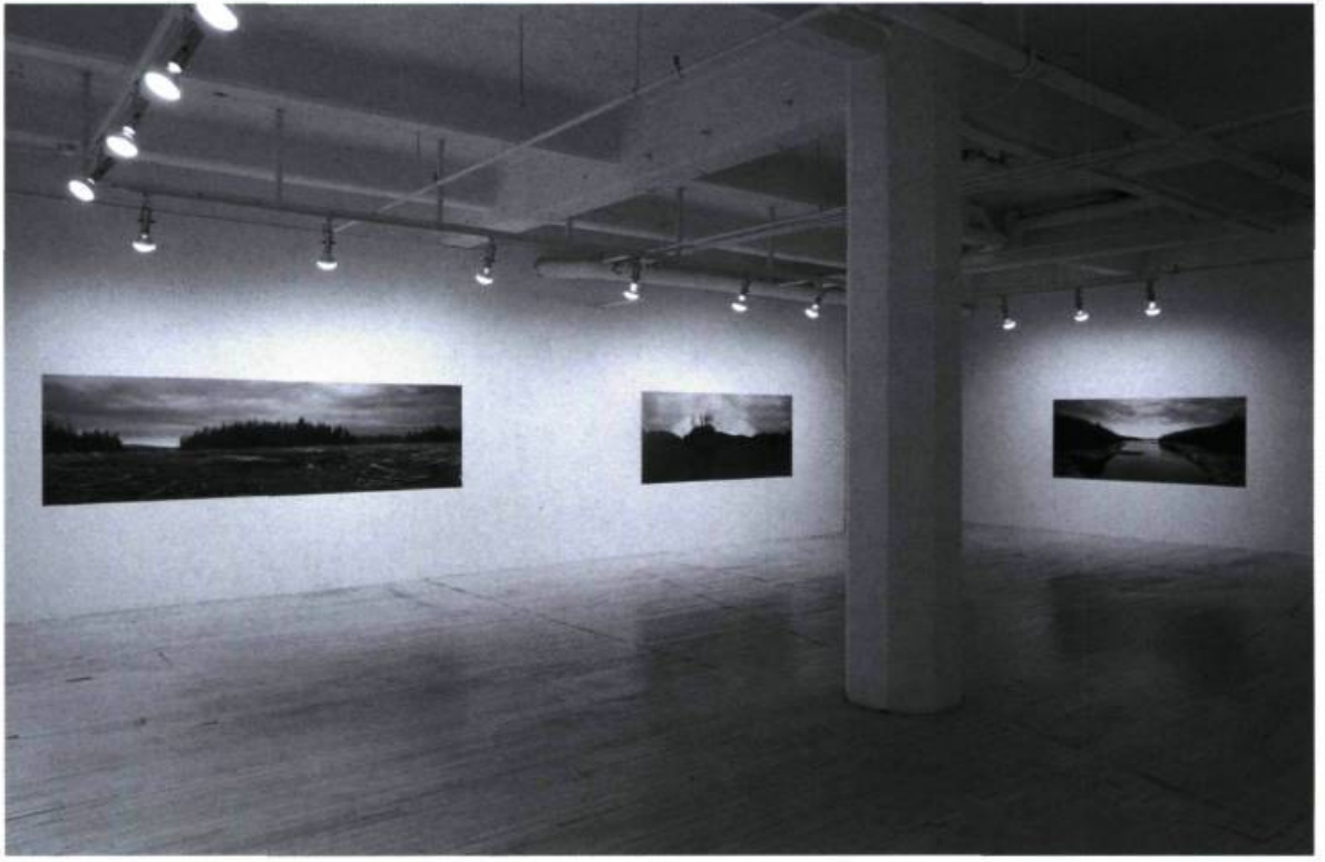
Isabelle Hayeur, Vue partielle de l'exposition Chantiers , Skol, Montréal.

sence et les activités des hommes. Non pas que des dépôts soient partout présents et habitent le paysage au même titre que ses éléments naturels, mais des empreintes de dérangement, pourrait-on dire, laissent l'impression que le sable, la terre, l'eau ou des pièces d'arbre ne reposent pas là où ils devraient. Ils gisent même parfois comme les interventions d'un Land Art incohérent, des manifestations d'Earth Works inachevés.