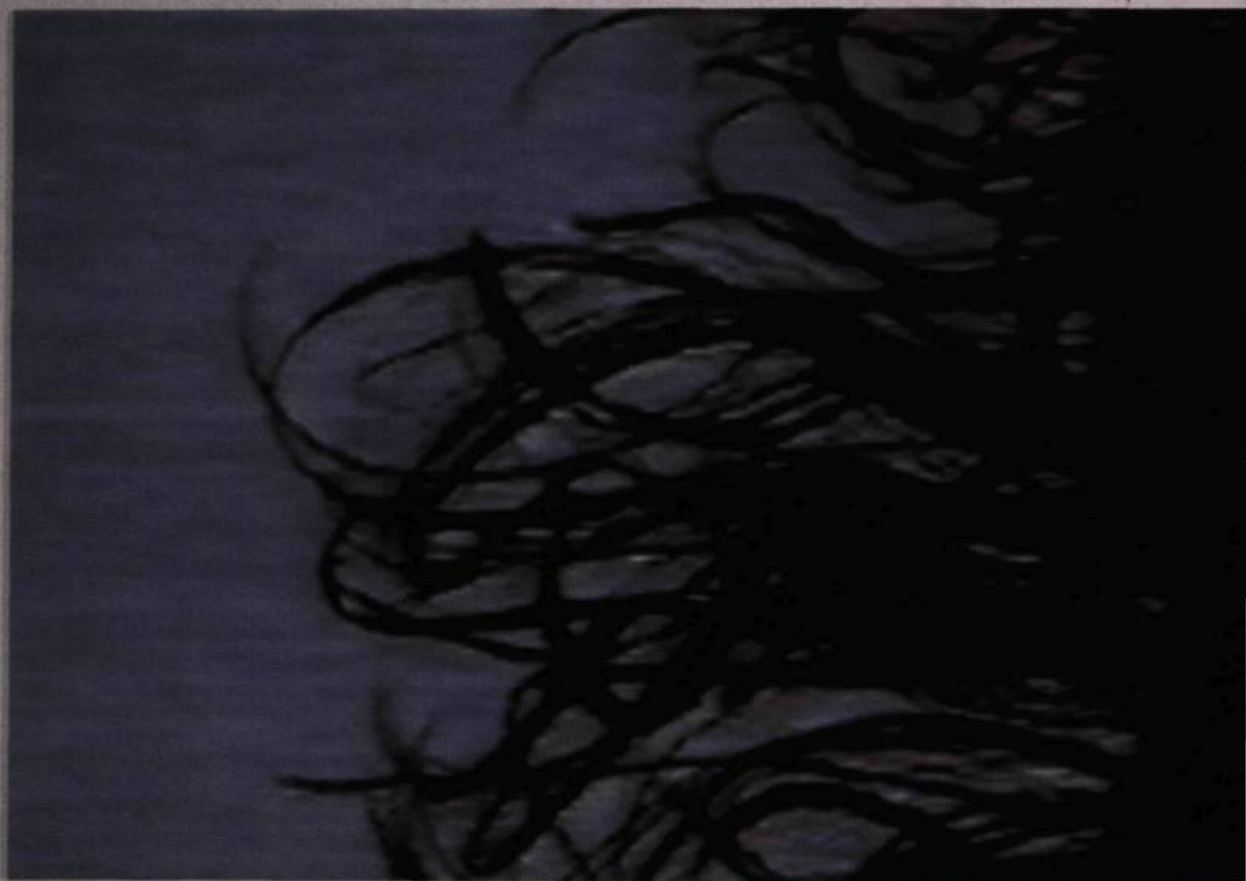
Ariane Thézé, Le chant des sirènes I , 2001. Galerie Éric Devlin, Montréal.

l'image, mais les transformations – agrandissements, allongements des formes, changements des couleurs – réalisées par ordinateur, à la main ou au moment de l'impression ont conduit à la fabrication d'un réel qui était en puissance. La chevelure devient algue marine noire ou colorée, selon les cas. On s'aperçoit de la dimension de crise, du choc de l'image dialectique mais aussi de sa dimension analytique critique, de mise en demeure de la représentation comme le « tourbillon » qui révèle sa structure. Il y a bien une structure dans l'image dialectique mais elle ne produit pas des formes régulières ou stables, elle produit des formes en transformation dont les effets sont ceux de perpétuelles déformations. Il y a également un travail critique de la