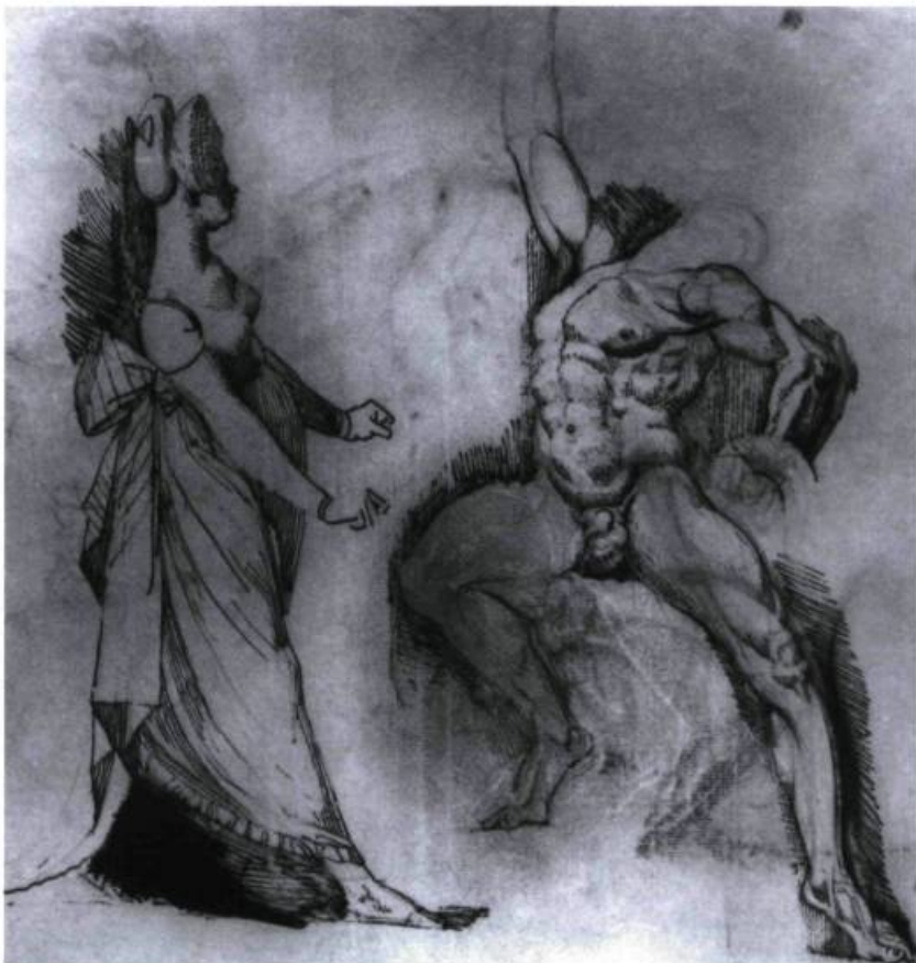
J. H. Füssli, Femme devant le Laocöon , 1801-05.

D'autres médiums qui pourtant pourraient eux aussi permettre une plus grande diffusion des images semblent avoir eux aussi été limités dans leurs usages. Dans le milieu des arts, les tirages photos se font de plus en plus en quantités limitées. Ce fut une révolution récemment lorsqu'une compagnie a réussi à convaincre des photographes de vendre en plus grand nombre (et moins cher donc) certaines de leurs images. Même la vidéo et le cinéma semblent être extrêmement contrôlés de nos jours. Matthew Barney, par exemple, présente au compte-goutte son cycle des Cremaster dans certaines villes et pour une période très limitée.