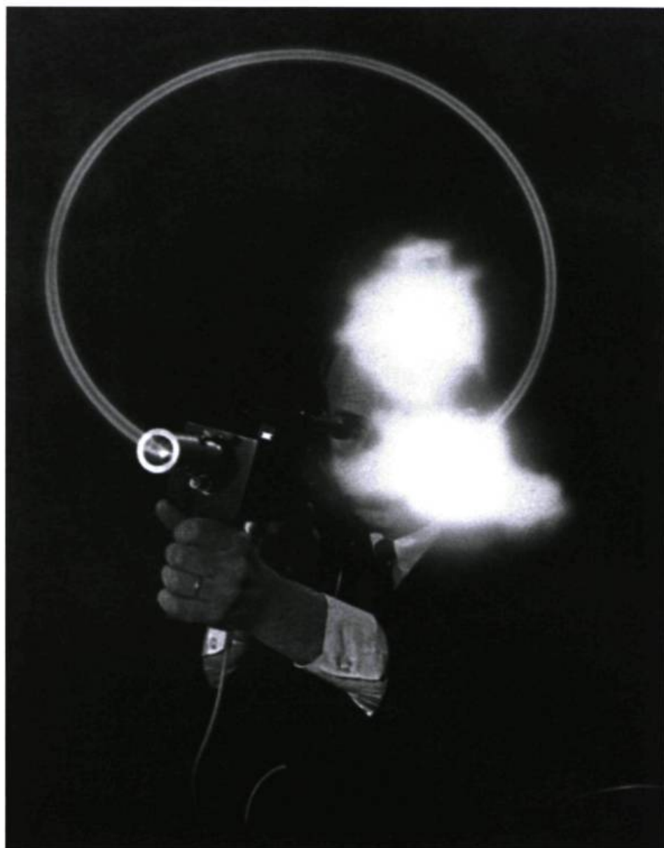
Patrick Everaert, Sans titre , 2001. Photographie couleur ; 70 x 54 cm, tirage unique, coll. Stéphane et Sylvie Corréar, Paris.

la course qui toujours le reconduit du désir de l'objet à l'objet de son désir. C'est-à-dire du champ de la visibilité (« ... j'entre dans la lumière ») à la conscience de ce champ (« ... j'en reçois l'effet »). Et partant, du regard en soi (celui qu'on a et d'où l'objet se manifeste) au regard pour soi (celui qu'on est et d'où l'objet se reconnaît). Objet scindé entre avoir et être qu'est donc le regard. Éblouissement qui en réalise l'impossible unité. Là s'enracine l'infini désir – prière d'insérer jouissance dans l'instant jubilatoire – à quoi la quête se suspend indéfiniment.