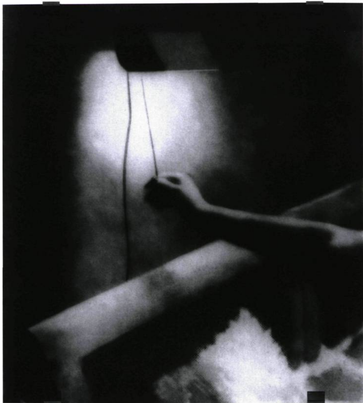
Jean-Marc Bustamante, Lumière 1. 87 , 1987. Sérigraphie sur plexiglas montée sur support métallique, 175 x 145 cm, collection privée, Paris, courtoisie Galerie Nathalie Obadia, Paris, et Galerie Daniel Templon, Paris.

graphique de la sculpture de bronze. Là, à l'exact endroit où la forme-corps se serait embrasée dans sa rencontre avec la lumière-matière. Avec « ... j'entre dans la lumière » s'unissant à « ... j'en reçois l'effet », fusionnelle étreinte que celle portée, hainamoration disait Lacan, dans le duel fulgurant entre l'objet et sa « présence hallucinatoire ». Duel amené à la hauteur du soleil et splendeur d'une œuvre où vient s'incarner la perte du désir d'objet pour le gain de l'objet du désir. La disparition de la visibilité donnée par figuration contre l'apparition d'une visibilité donnée par procuration. À la réserve du nom toutefois, lequel désignant, tel L'Oiseau d'or , ce qui est littéralement devenu l'objet du manque. Aussi – et de l'ex-pliquer, c'est-à-dire de l'extraire du pli de l'ombre – n'est-ce pas la fulgurance que donne à réfléchir le « brancusien regard de