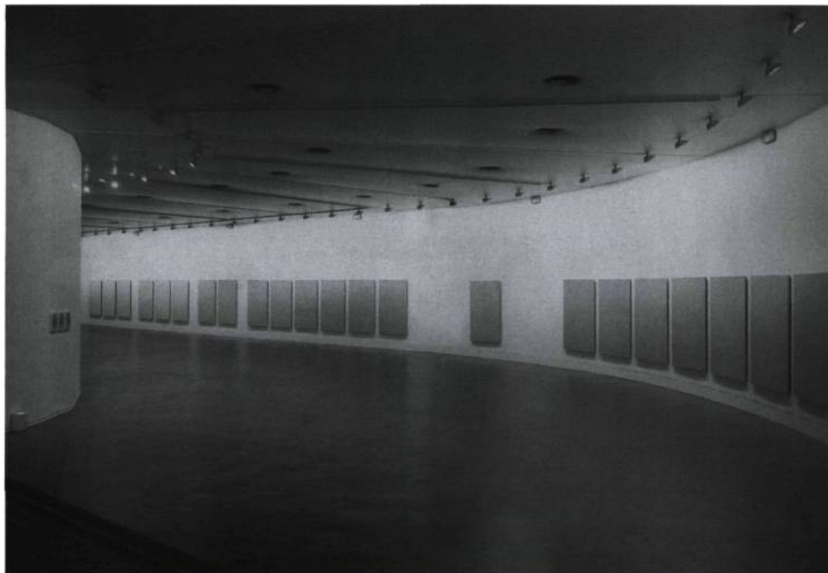
Roman Opalka, Musée de la Ville de Paris, 1992.

(Dé)saisissement donc – ou perte de l'œuvre pour le gain de son autre-né, à savoir elle-même gagnée en pur instant de la transe – l'éblouissement vient ici en point de contact pour l'objet du désir (le regard à l'œuvre) découvert sans voile comme objet de la perte (le regard hors l'œuvre). Ou plutôt placé au point du dévoilement de l'objet qu'il est au fond, rayonnant mais défaillant à penser l'infigurabilité hors la figure du vide qui se produit là, sur l'image photo-