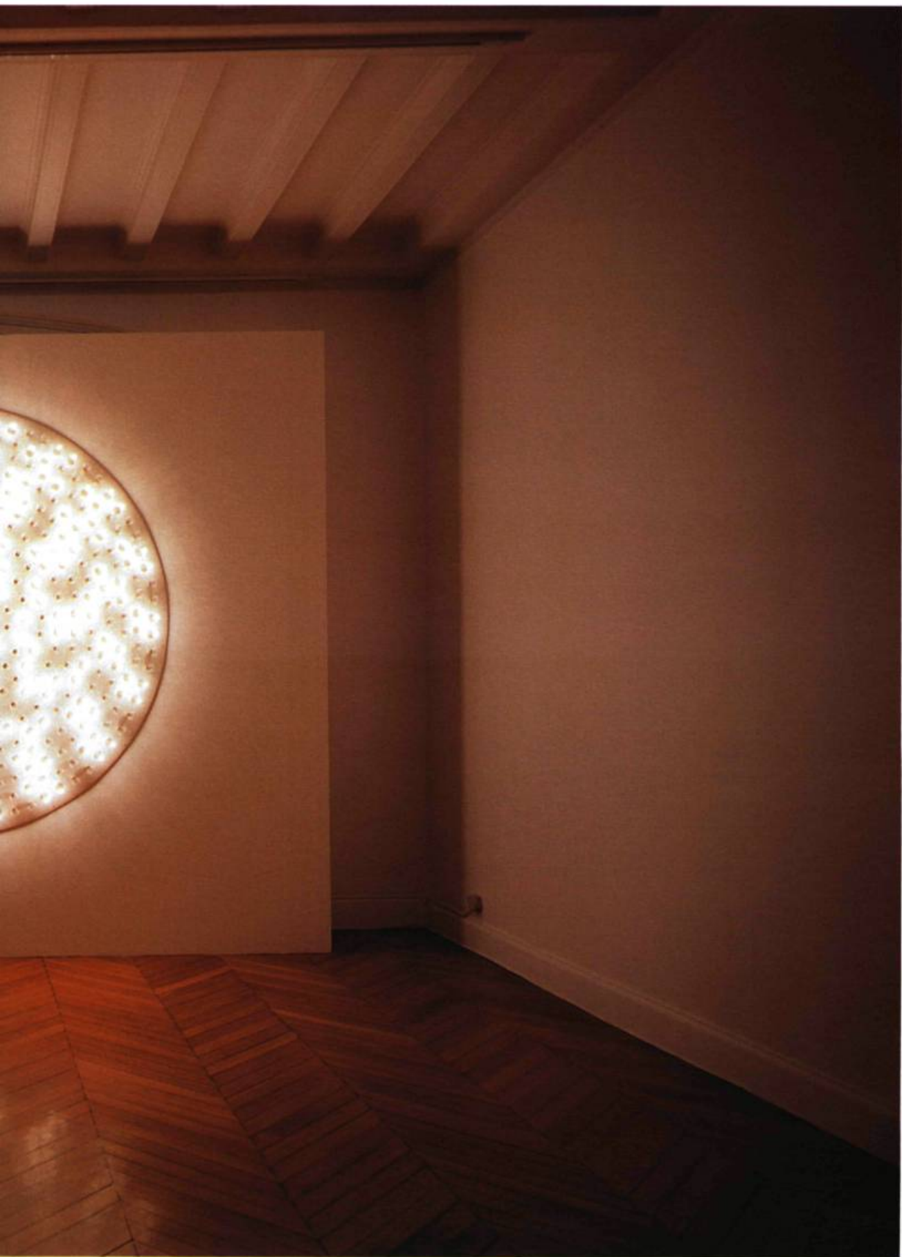
Guillaume Paris, Numenous , 2002, Dôme en polyester stratifié, 500 ampoules, animateur électronique, 195 x 195 x 25 cm.