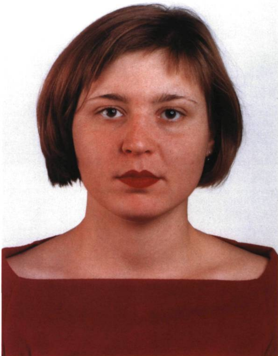
Thomas Ruff, Portrait , 1999. Courtoisie Galerie Mai 36, Zurich.

plus, sous l'influence de la sociologie et de l'anthropologie, les historiens de l'art s'intéressent maintenant aux formes précoces du portrait considéré, avant même la notion de genre, comme toute figuration de l'individu pour lui-même 7 . Selon cette acception générale, le portrait ou l'autoportrait traduit toujours un rapport de l'être humain à lui-même. Il est un moyen visuel par lequel l'individu s'interprète, s'invente. Picasso rétorquait à ceux qui n'appréciaient pas son portrait de Gertrude Stein par manque de ressemblance : « Vous verrez, elle se ressemblera », soulignant ainsi les degrés de liberté de l'artiste dans la figuration, et l'autonomie de la représentation.