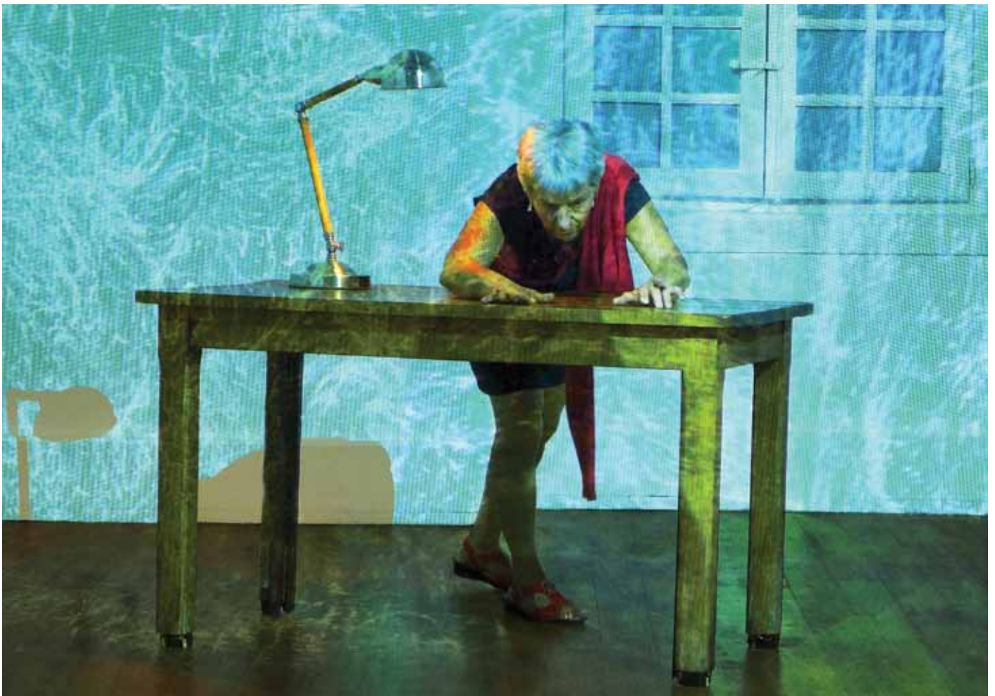
La maison sensible. Exposition à l'Abbaye de l'Escaladieu / festival Horizons numériques, Bonnemazon, 2015.