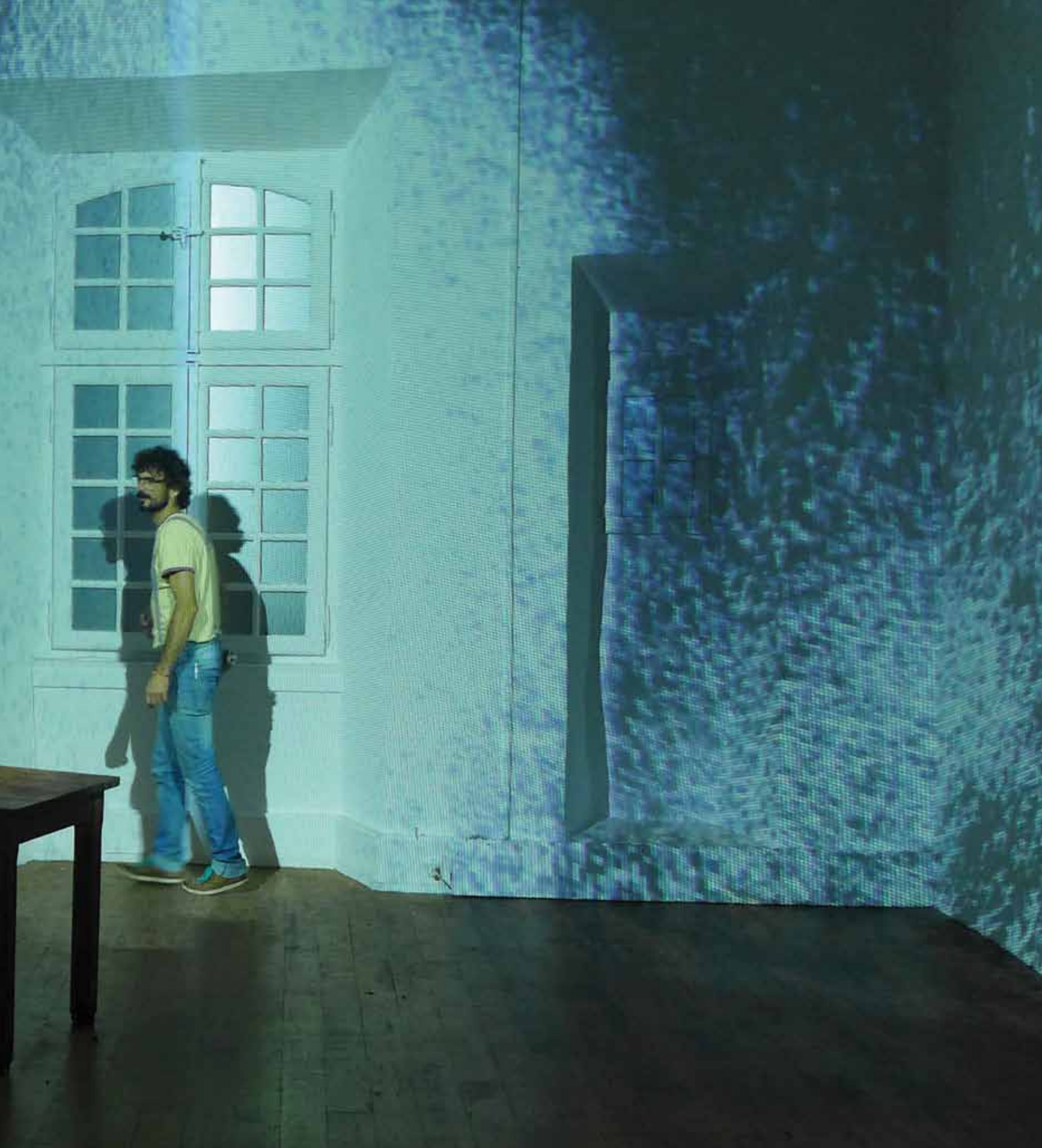
La maison sensible , exposition à l'Abbaye de l'Escaladieu / festival Horizons numériques - Bonnemazon (France), 2015.