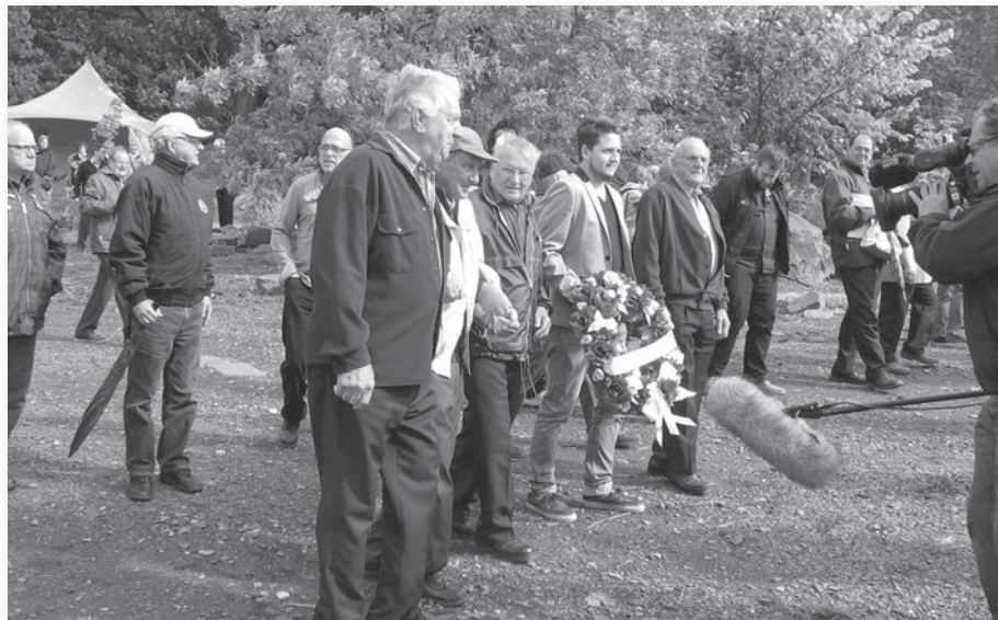
Cérémonie en hommage aux victimes de la drague Manseau 101 au sentier des Grèves, 15 septembre 2012

Les épaves répertoriées par le Service hydrographique du Canada en 2010 correspondent certainement à des naufrages connus. On doit maintenant les associer aux épaves. Le portrait des fonds marins se dessine tranquillement à