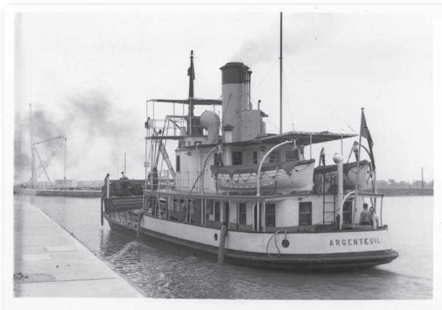
Le navire Argenteuil

Construit en Angleterre en 1919, le Michalis porta brièvement le nom de War Capitol avant d'être rebaptisé Elveric . En 1933, il a été renommé Kassos et Michalis en 1939. Cargo typique des années 1920 de par son architecture caractéristique avec timonerie centrale, ce navire a été utilisé dans différents convois au début de la Deuxième Guerre mondiale. Parti lourdement chargé de Montréal le 19 novembre 1941, le Michalis devait se rendre à Sydney en Nouvelle-Écosse pour rejoindre un convoi.