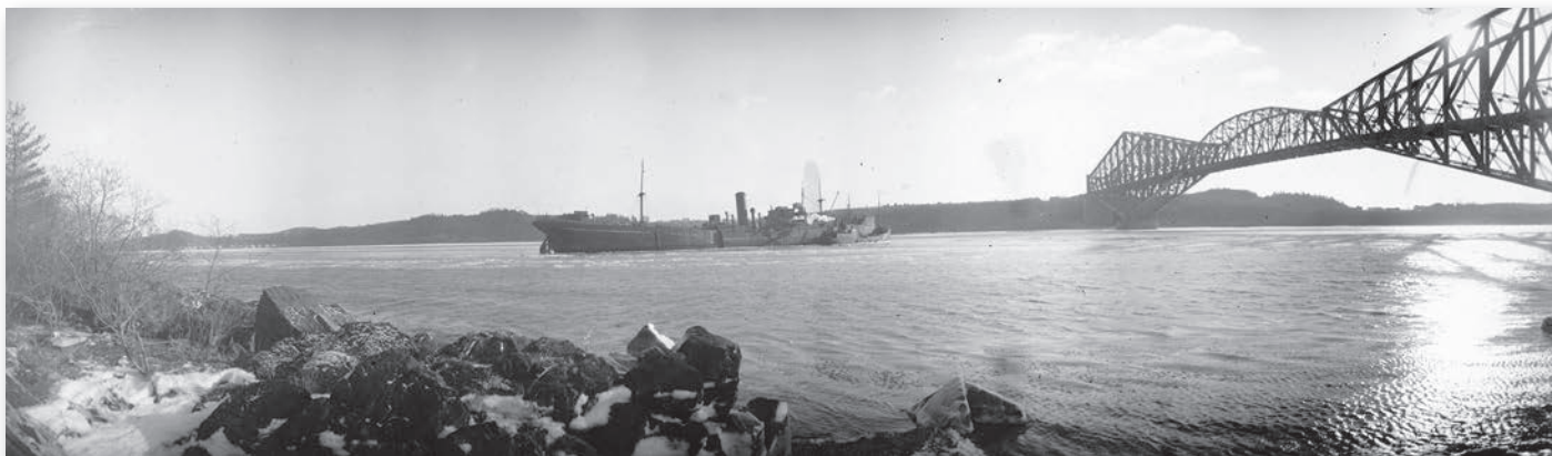
Le Michalis , au lendemain de son échouement, 1941.