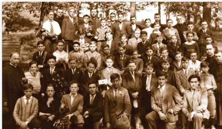
Groupe de jeunes naturalistes ayant pris part à la première excursion générale des CJN au mont Royal, 1931.