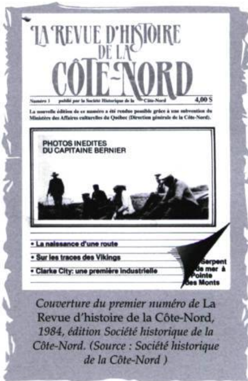
Couverture du premier numéro de La Revue d'histoire de la Côte-Nord, 1984, édition Société historique de la Côte-Nord.

Par écriture nord-côtière, on entend toute écriture qui évoque d'une façon ou d'une autre la Côte-Nord. Le concept d'écriture nord-côtière se définit par conséquent par rapport à un territoire. Ce « territoire-référent » se précise à travers trois grands espaces. Le premier est géographique : un littoral qui s'étend de Tadoussac à Blanc-Sablons. Le second, historique : plus de quatre siècles (des textes de Jacques Cartier aux plus récents, qui, dès les tout débuts, inscrivent dans leurs propos la rencontre avec les autochtones). Le troisième, d'ordre humain et culturel. Trois identités le construisent : autochtone, francophone et anglophone qui ont chacune leur histoire, leur culture et leurs écritures. Le corpus nord-côtier, exceptionnel par sa quantité, sa