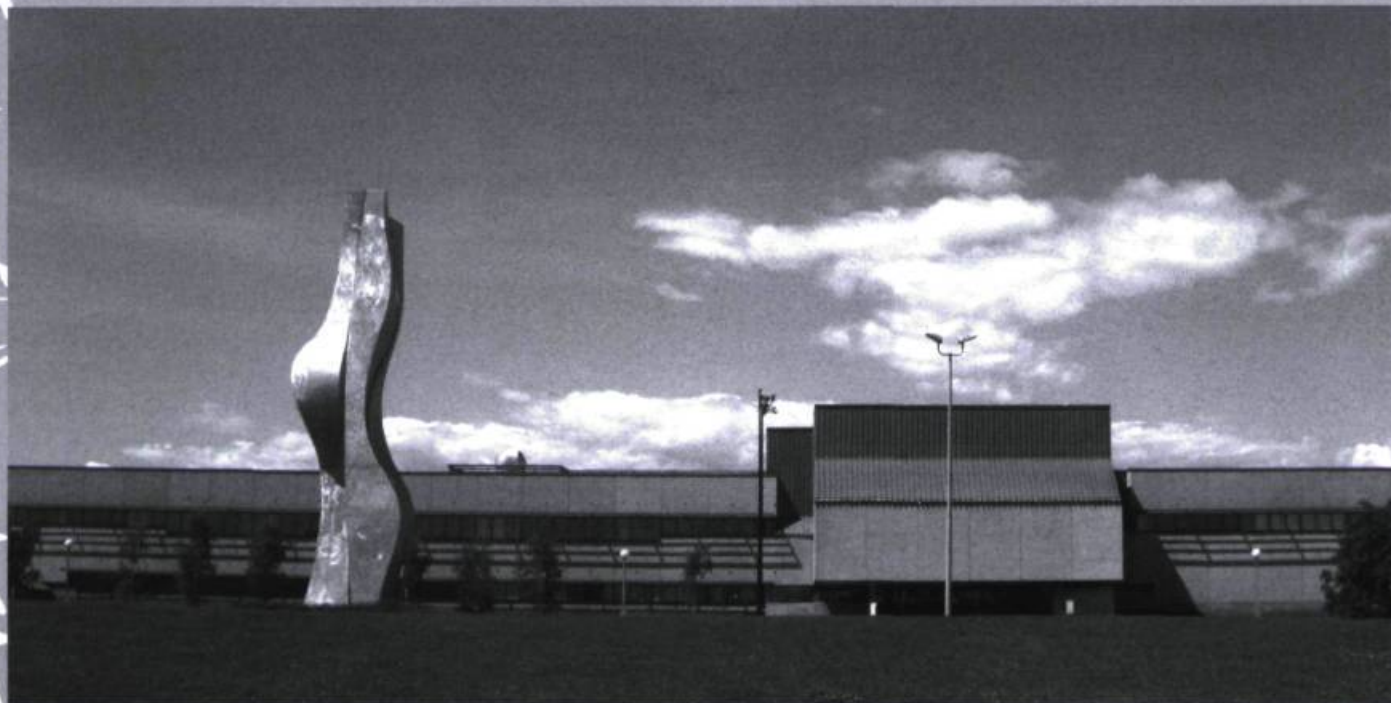
Le Cégep de Sept-Îles abritant le bureau du Grénoc.

explicitement la question de l'imaginaire, il en a pressenti l'importance quand il parle dans son avant-propos d' « étudier la littérature en fonction de l'histoire et de la géographie » pour vibrer avec les écrivains qui ont regardé « la Côte avec un œil neuf ou qui l'ont tout simplement connue et aimée depuis toujours 5 ». Saluons aussi Damase Potvin, un écrivain trop rapidement dit régionaliste qui manifesta pour la Côte-Nord un intérêt évident, dont témoignent certaines publications : Les Îlets Jérémie (1928), En zigzag sur la Côte (1929), Puyjalon (1938), Le Saint-Laurent et ses îles (1945), qui amorcent une réflexion sur l'attrait exercé par les régions nordiques, inaugurant une sorte de « critique de la nordicité ». Son attachement l'amène à publier, en 1944, Les Oubliés / Écrivains nordiques 6 , où il s'interroge sur la « Côte-Nord, si mystérieuse encore 7 ».