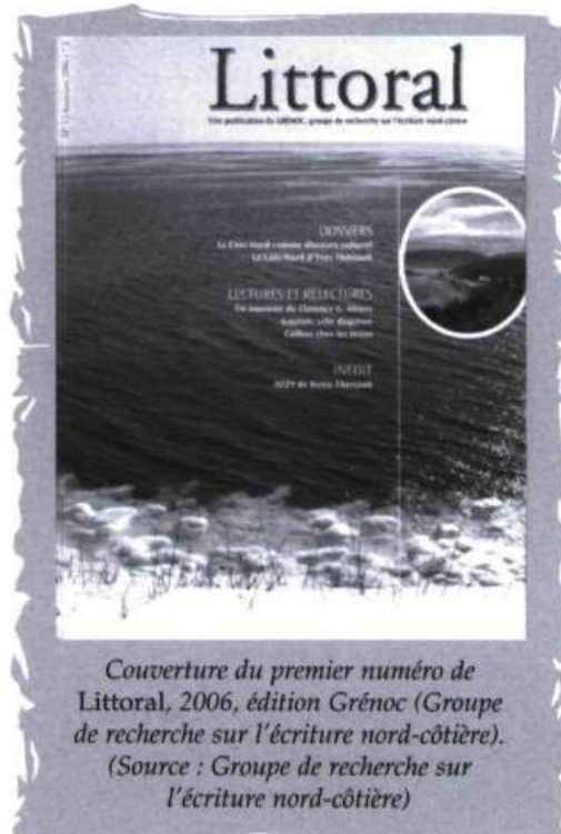
Couverture du premier numéro de Littoral, 2006, édition Grénoc (Groupe de recherche sur l'écriture nord-côtière).

longévité et sa diversité, est plutôt de genre qui fait voyager. L'écriture d'ici est d'abord redigée par des nomades avant de l'être par des sédentaires bien établis dans leurs lieux? Le premier