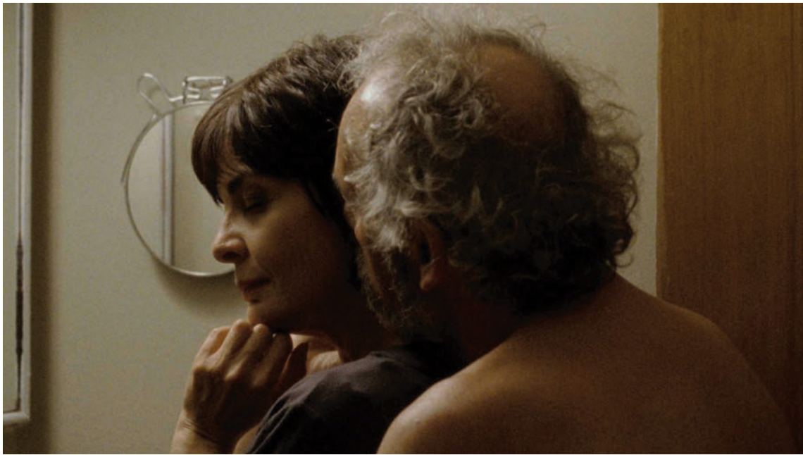
LA MISE À L'AVEUGLE (2012)

parfaitement sentis, leur permet de livrer leur corps et leur parole, et la parole de leur corps, avec une intelligence, une simplicité et une acuité si rares, lesquelles font justement corps avec la position de celui qui les restitue à l'écran. Ces gens ne se seraient jamais livrés avec un tel abandon serein s'ils s'étaient vus imposer la violence idéologique ou théorique d'un cinéaste en quête de pouvoir ou d'autorité.