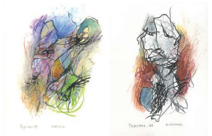
Deux dessins de la série « Tropismes »

L'installation est basée sur quatre boucles de durée différentes jouant sur quatre écrans. J'ai rapidement su que la différence de longueur entre chaque boucle devait être assez importante, soit au moins une minute de façon à ce que la recombinaison soit, elle aussi, importante à chaque répétition. Cela permettait qu'au-delà des 40 minutes de matériel réparties sur quatre écrans, et même si après treize minutes on a tout vu au moins une fois, il continue à y avoir des surprises dans la rencontre des différents segments et dans cette réorganisation organique de la matière. Les interventions typographiques, les passages au noir, les dessins,