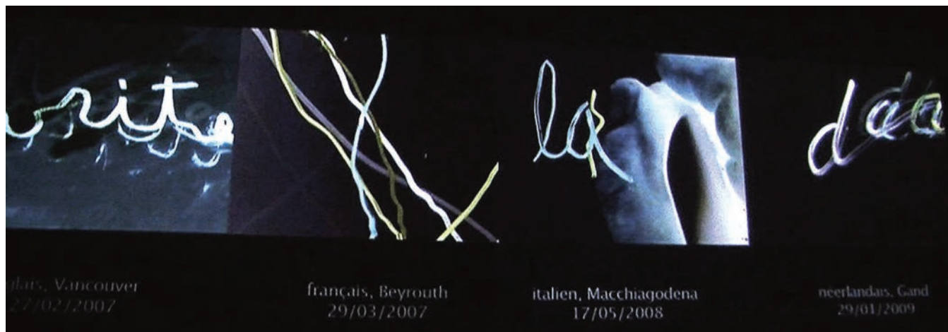
Installation SEULE LA MAIN , Montréal, novembre 2009

propos recueillis par Marie-Claude Loisele