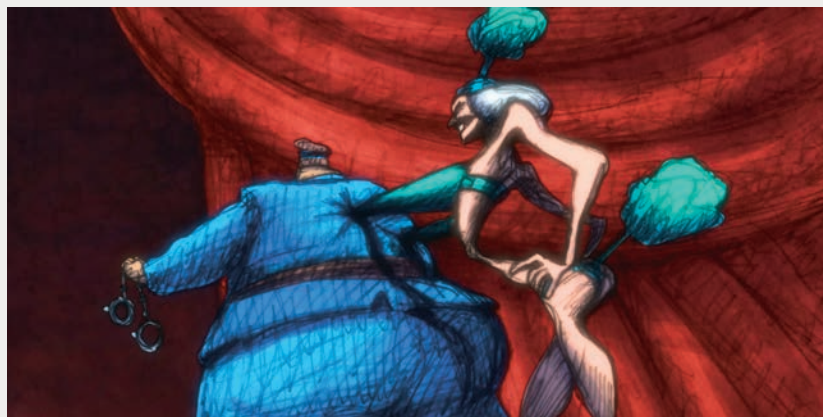
THE ZERO THEOREM de Terry Gilliam et CHEATIN' de Bill Plympton

À L'HEURE OÙ J'ÉCRIS CES MOTS, LE FESTIVAL FANTASIA BAT SON PLEIN. CE COMPTE-RENDU DE L'ÉVÉNEMENT est donc nécessairement incomplet. La dernière semaine nous réserve sans doute encore quelques surprises, en plus de films très attendus tels que le controversé Welcome to New York d'Abel Ferrara ou encore Real de Kiyoshi Kurosawa. Néanmoins, l'éclectisme et l'audace générale de la programmation nous permettent déjà d'affirmer que cette 18 e édition compte parmi les plus intéressantes des dernières années.