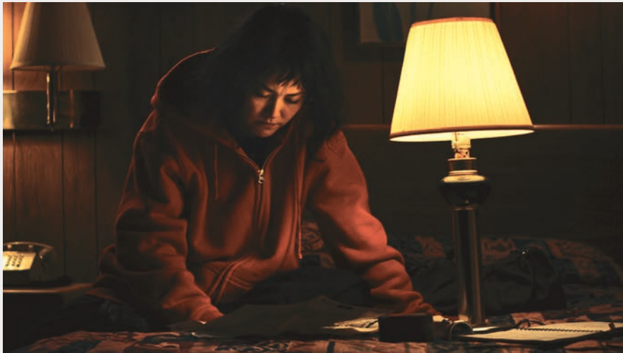
KUMIKO, THE TREASURE HUNTER des frères David et Nathan Zellner

de leitmotiv visuels, le film se laisse porter par la poésie de ses images subjectives, transposant habilement l'esprit d'un lieu à l'écran et posant sur celui-ci un regard réellement habité. Ici, l'héritage New Age de l'Amérique devient une extension de son folklore, l'idée de fantôme servant à lier les époques, à faire le pont entre les générations. Sensible et intelligent, The Midnight Swim s'avère une réussite d'autant plus appréciable qu'il s'agit d'un premier long métrage pour la cinéaste américaine Sarah Adina Smith.