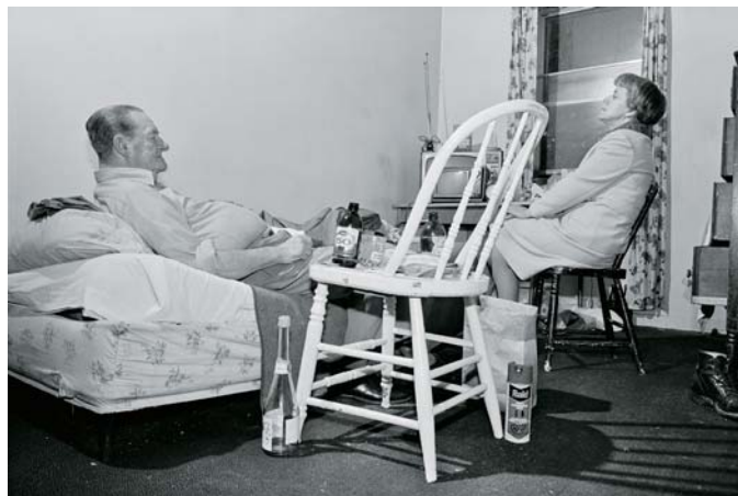
REALITY AND MOTIVE IN DOCUMENTARY PHOTOGRAPHY part 1 et 2 (1986)

J'ai eu à un certain moment le sentiment que mes photographies devenaient « muettes », qu'elles n'avaient plus rien à dire, qu'elles n'étaient plus assez électriques. Je trouvais qu'elles n'arrivaient plus à exprimer avec suffisamment de force mes préoccupations du moment, ce que j'avais à dire. Je m'interrogeais sur la tradition dans laquelle j'évoluais, sur le type de photographies que je prenais, sur le genre de documentaire que je pratiquais.