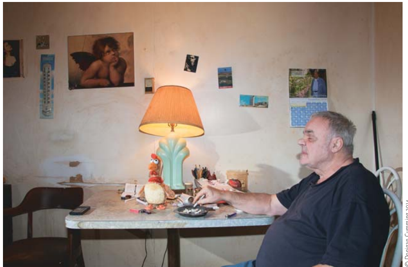
EXIT INTERVIEW (2014)

C'est bien sûr une provocation. Je suis un artiste parce que j'aime, parce que j'espère, parce que je cherche à changer ce que les gens ont dans la tête, tout en ayant un certain contrôle sur la façon de le faire. Je cherche à amener les gens à penser différemment, tant leur réalité, que le monde dans lequel ils vivent, leur propre corps, ce qui va leur arriver quand ils vont vieillir... Je cherche à les amener à imaginer leur vie si les circonstances avaient été