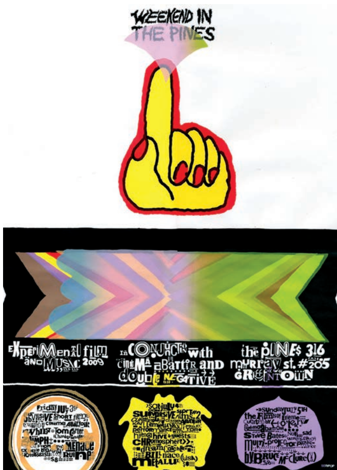
Affiche du Weekend In The Pines