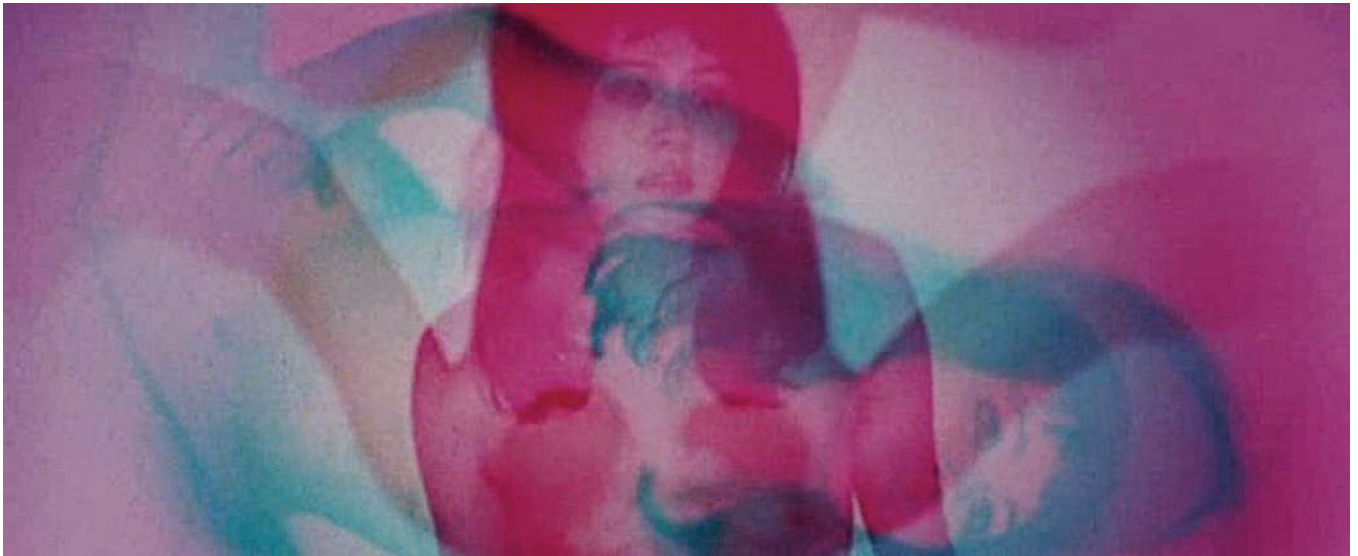
Visa de censure n° X (1967) de Pierre Clémenti

je projetais aussi en dehors de l'écran. Ailleurs dans la salle. Les gens n'appréciaient pas toujours. Aujourd'hui, j'utilise encore des projections vidéo lors de mes concerts. Cela a d'abord été une manière de déjouer les catégories que l'on tentait de m'imposer, d'éviter que l'on associe ma musique à un genre en particulier – comme le noise , par exemple. L'idée, c'est d'amener à travers l'image une autre dimension à la musique. Durant un certain temps, j'ai réalisé mes images moi-même. Puis j'ai décidé de collaborer plus étroitement avec Charles Barabé. J'aime l'idée de travailler avec une seule personne, de forger une relation. Ce que fait Charles est très coloré et, d'une certaine façon, aux antipodes de ma musique. En concert, je crois que le support visuel libère le musicien – qui peut alors expérimenter davantage, parce que l'image sert en quelque sorte d'ancrage pour le public.